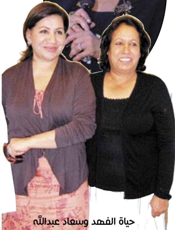
حياة الفهد وسعاد عبدالله