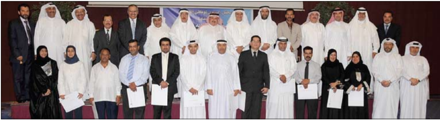
صورة جماعية لمسؤولي «الغرفة» والموظفين المكرمين

يفتتح صباح اليوم (الخميس) في معرض التخفيضات السنوي «بازار الحواج» في مركز البحرين الدولي للمعارض، وتستمر فعالياته حتى يوم الأحد المقبل (31 مايو / أيار الجاري)، وسيتم عرض مستحضرات التجميل والعلطور والشنط والهدايا بأسعار مخفضة، بالإضافة إلى مجموعة من إلكترونيات سامسونج