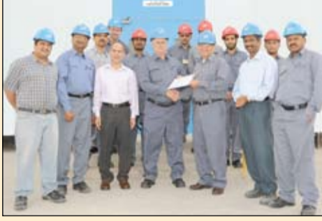
فريق العمل بمشاريع ألأبا، للطاقة أمام المحطة الفرعية

قال مسئول تنفيذي، أمس الأول، إن مجموعة أعمال خاصة، مقرها الإمارات أطلقت أول شركة عربية لاستكشاف اليورانيوم، في حين تعتزم دول إقليمية عديدة بناء مفاعلات نووية. وأطلقت شركة مشاريع اليورانيوم العربية، وهي وحدة لشركة آل ثاني القابضة، أمس الأول، وستعمل في تعدين الفلز المشع بالشرق الأوسط وإفريقيا.