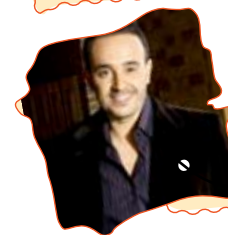
صابر الرباعي - واحشني جداً