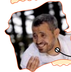
جورج وسوف - الله كريم