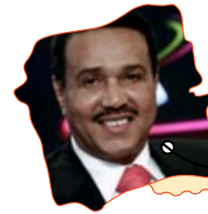
محمد عبده - وحدك