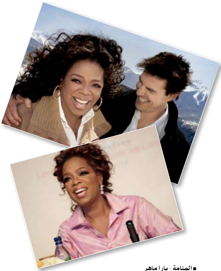
■ الصنامة - يارا ماهر

□ التواصل مع الناس والاقتراب من هموم حياتهم وقضاياهم، فن يجتهد فيه الكثيرون، ويبدع فيه القليلون فقط. والبرامج الحوارية، أو ما بات يعرف بيننا بـ «التوك شو» هي خير دليل وأنموذج، فعلى رغم تكاثر هذا النوع من البرامج على الشاشات العالمية والعربية، بمختلف النماذج الجدية والخفيفة، فإن الأسماء المتميزة والمتفردة في هذا المجال مازالت قليلة ومحصورة ببعض الوجوه.