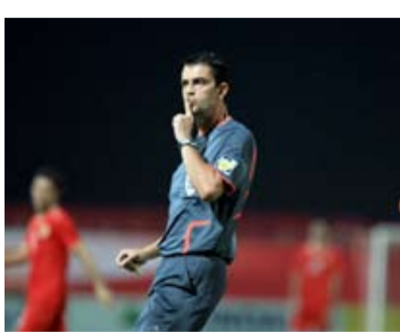
أي إنذار شفهي على رغم مطالبات لاعبي منتخبنا الوطني المتكررة منذ بداية الشوط الأول، ولم

□ ليس غريباً أن يتعمد لاعبو المنتخب النيوزيلندي إضاعة الوقت منذ الثانية الأولى للمباراة لأنهم يلعبون خارج أرضهم وليس مطالبين بالفوز في الذهاب طالما أن مباراة الإياب على أرضهم، ولكن الغريب تعامل حكم المباراة المغربي كاساي الذي تعامل ببرود حاد مع مثل هذه الحالات التي تكررت كثيراً خلال المباراة من دون أن يعطي