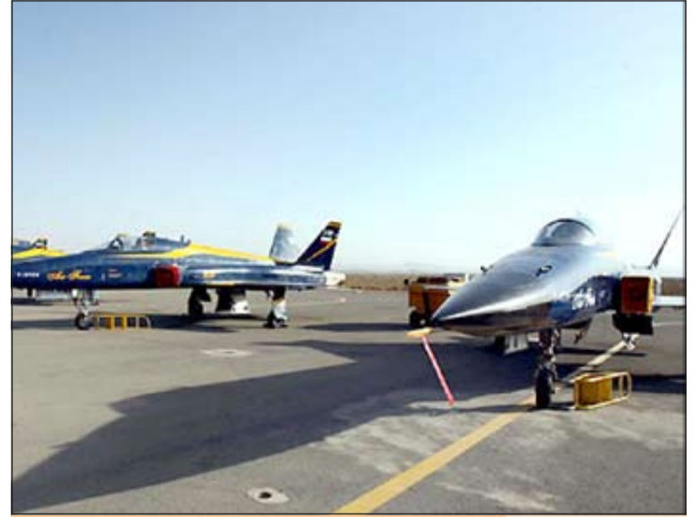
طهران تختبر مقاتلات جديدة من طراز «صاعقة» وتسلمها للقوات الجوية (مهر)