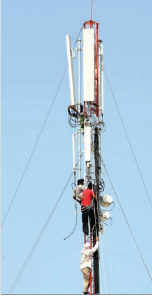
عملية تركيب أحد أبراج الاتصالات