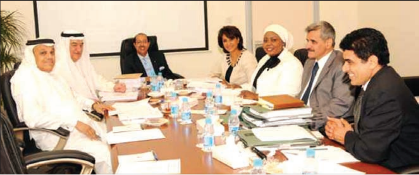
جانب من أحد اجتماعات لجنة الشؤون المالية والاقتصادية بمجلس الشورى (صورة أرشيفية)

وأوضحت اللجنة بأن الدولة قامت بتخصيص أموال لرفع كفاءة الجهاز الحكومي، إذ إن الإنتاجية والكفاءة في القطاع الحكومي منخفضة، وهو ما يعيق التقدم والنمو، متسائلة فيما إذا كان معدل الإنتاجية في القطاع العام قدر توقع.