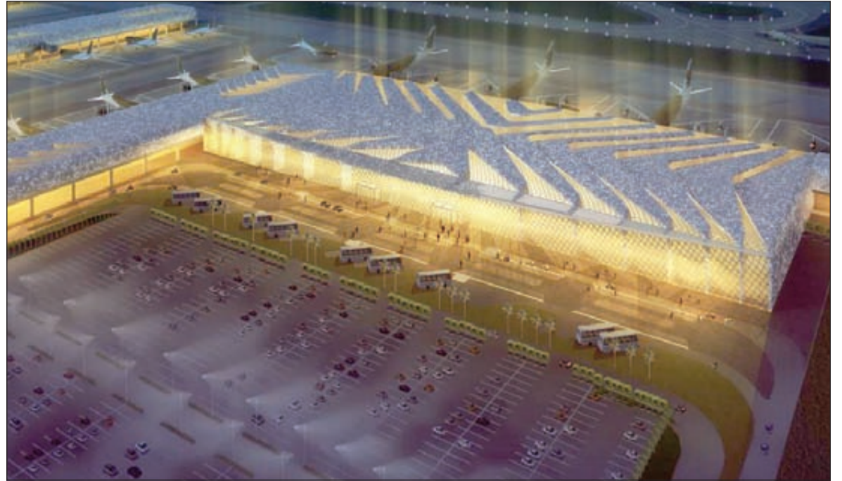
رسم تخيلي للمطار من الخارج