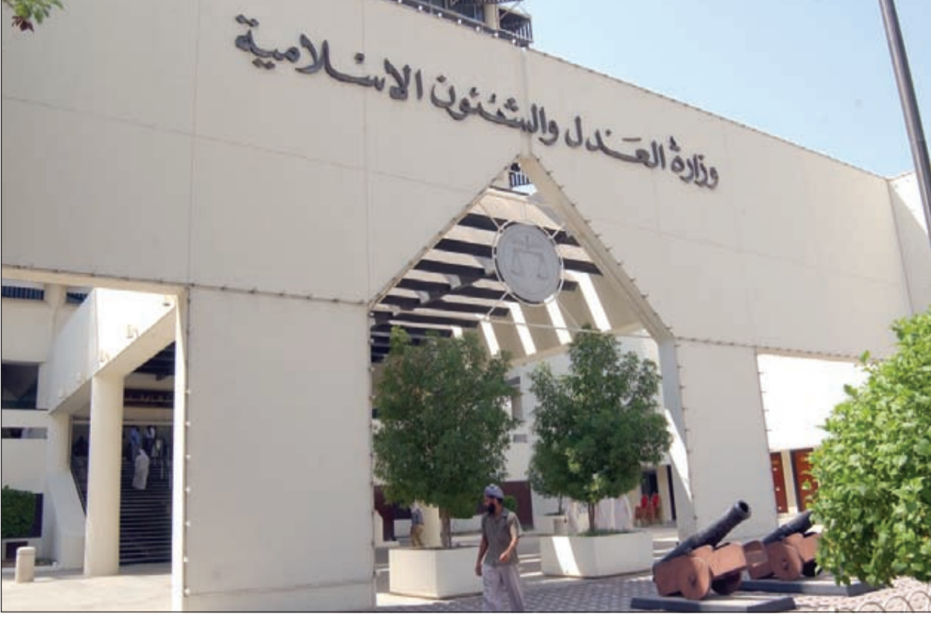
هل ينجو مدير بنك الإسكان من عقوبة السجن مع بقاء استئنافه للحكم؟

وفي حين لا يزال المدير السابق طليقاً، إلا أنه وفور النطق بالحكم