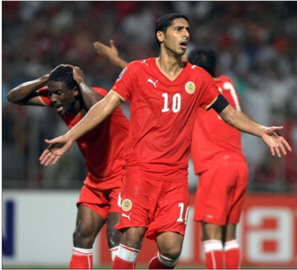
حسرة بحرينية على التعادل بلا أهداف

خرج منتخبنا الوطني الأول لكرة من مباراة الذهاب في رحلة الملحق الأخير أمام المنتخب النيوزلندي متعادلاً من دون أهداف. وقد شهدت المباراة إضاعة للفرض السهلة من قبل لاعبي منتخبنا خلال الشوط الثاني، وأغلامها فرص حسين علي وسلمان عيسى وسيدمحمد عدنان والتي أخرجت جماهيرنا الغفيرة التي زحفت إلى الاستاد الوطني في وقت مبكر حزينة، وإن لم تفقد الأمل الحلم المؤجل إلى يوم 14 نوفمبر / تشرين الثاني المقبل في مباراة الإياب في نيوزلندا.