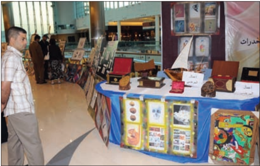
معرض الاحتفال باليوم العالمي للصحة النفسية في مجمع السيف