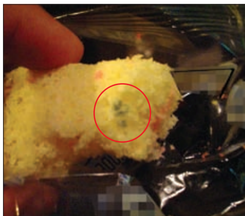
مواطن يشتكي من مخبز باعه كعكاً متعفنًا

وأوضح المواطن بأنه حمل الكعك وتوجه إلى المخبز إلا أن العامل الموجود في المخبز حاول تعويضه، إلى جانب أن العامل أخذ ينكر ويقول بأن هذا الكعك تم صنعه قبل يومين، في الوقت الذي أكد فيه مسبقاً للمواطن خلال الزيارة الأولى بأن الكعك تم صنعه يوم الأربعاء وهو اليوم الذي اشتري فيه الكعك.