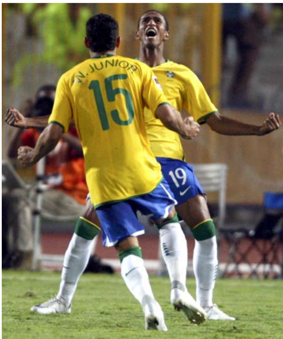
فرحة مايكون بالهدف الثاني

ماركيس بيتينكورت من تسجيل الهدف الثاني لراقصي السامبا في الدقيقة الأولى من الشوط الإضافي الأول عندما استغل تقدم الحارس الألماني خارج مرماه ووضعها من فوقه في الشباك.