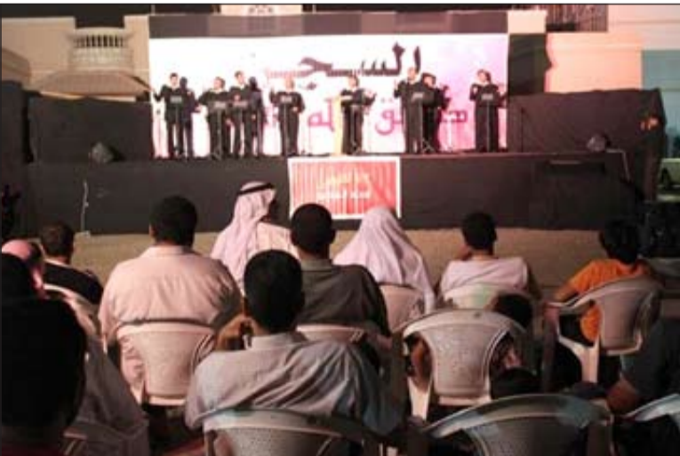
الفعالية التضامنية التي نظمها أهالي متهمي «كرزكان» للمطالبة بالإفراج عن معتقليهم

وكان في مقدمة المشاركين في الأمسية التضامنية النائب البرلماني الشيخ حسن سلطان الذي أكد في كلمته أن الفرصة لا تزال متاحة لطى الملف الأمني في البلد؛ مؤكداً ضرورة أن يبقى الخلاف بين المعارضة والسلطة ضمن المسار السياسي، داعياً إلى تجنب البلاد الانجرار إلى المزلزل الأمني وذلك بإطلاق سراح المعتقلين المظلومين، بحسبه، الذين تعرضوا للتعذيب والتنكيل. كما شاركت فرقة أصداة الغدير بعملها