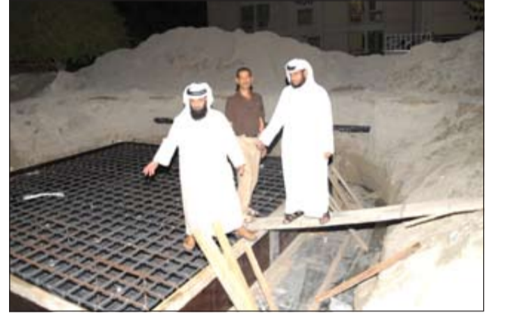
النائب وعضو المجلس البلدي في موقع تركيب البرج غير المرخص

وأكد أن الموقع الذي تم وضع البرج فيه سيخصص للمشاريع