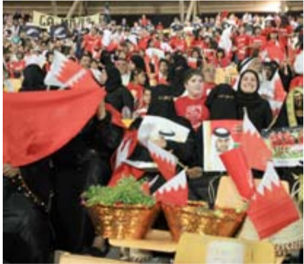
بشكل تلقائي خصوصاً لما يبادر عدد من الجماهير البحرينية بالابتعاد.

□ من المفترض أن تكون المدرجات المغطاة على يمين المنصة الرئيسية مخصصة للعوائل (الجزء الأكبر منها) والبقية للجمهور النيوزيلندي، ولكن قبل المباراة اختلط الحابل بالنابل وصارت المدرجات خليطاً ما بين العوائل وطلاب المدارس الخاصة على ما يبدو، ومع تقارب الفنتين اعتلى صوت الغوضى خصوصاً لما أطلقت