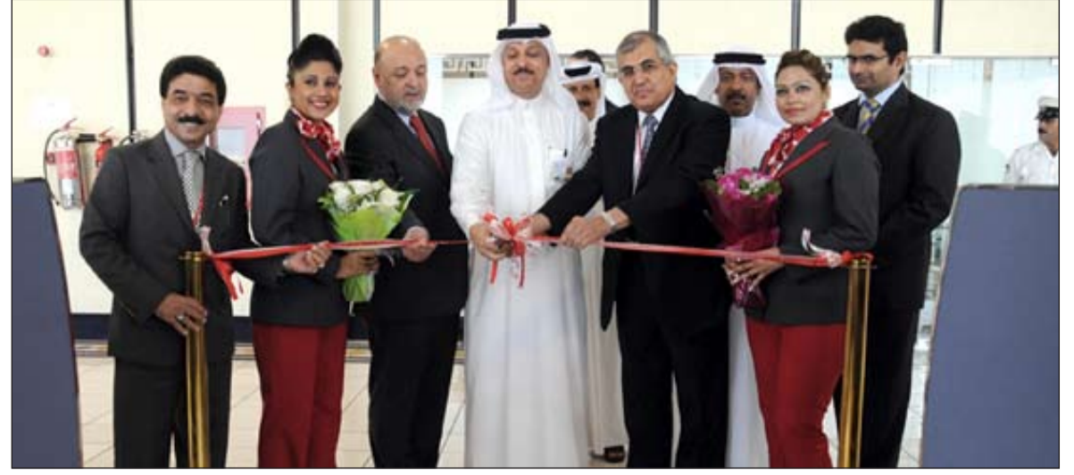
إبراهيم الحمير يفتتح خط طيران النجف

وتابع "ستركز إدارة الشركة في المرحلة المقبلة على توقع عدة شركات استراتيجية مع شركات محلية وخليجية لتقديم خدمة أفضل على المستويين التكنولوجي والتسويقي للمؤسسات والأفراد"، مشيراً إلى أن الشركة تهدف بالدرجة الأولى من توقع هذه الاتفاقيات إلى تقديم خدمات متكاملة مجانية للأفراد. كما بين الشعلة أن الموقع سيعمل كواجهة اقتصادية تروج لشركات المملكة إضافة إلى الترويج للاستثمار بالمملكة