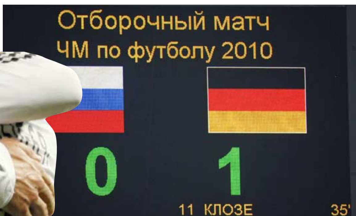
نتيجة المباراة التي انتهت لألمانيا

أخرى مرت قريبة جدا من القائم الأيمن (52)، قبل أن يرد الروس بفرصة خطيرة للغاية لإرشافين الذي وجد نفسه في مواجهة ادرل بعد تمريرة من كيرجاكوف لكن الحارس الألماني تألق في الدفاع عن مرماه (53). ولجأ هيدينك إلى بافلو تشنكو وادخله على حساب جيركوف (55) بهدف تعزيز خط الهجوم وأدرك التعادل الذي كان قريبا جدا من أصحاب الأرض بعد تسديدة صاروخية أطلقها بيستروف من خارج المنطقة إلا أن محاولته مرت على بعد سنتمترات قليلة جدا من العارضة (56).