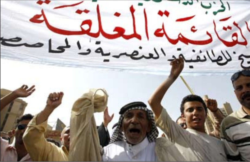
متظاهرون عراقيون في بغداد ضد القائمة المغلقة

وفي كركوك، خرج مئات من عشائر العرب السنة، وسط إجراءات أمنية مشددة، مؤيدين اعتماد القائمة المفتوحة.