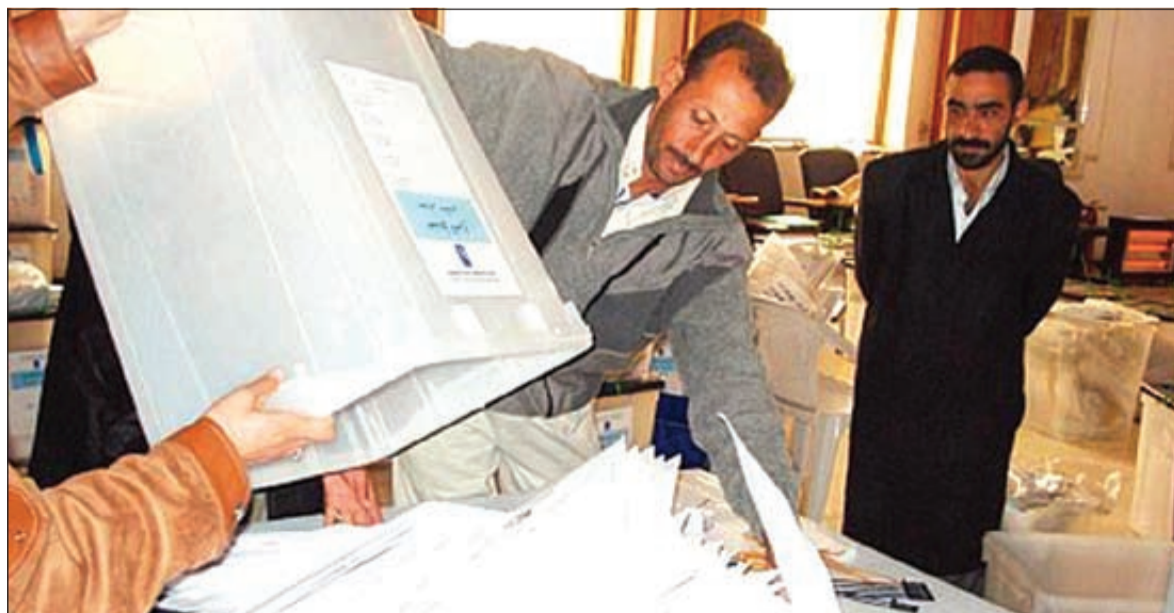
من عمليات الفرز في الانتخابات الماضية

وأفاد النظام رئيس الوزراء نوري المالكي الذي لقيت رسالته لفرض القانون والنظام صدى لدى الناخبين الذين سئموا سنوات من أعمال العنف وإراقة الدماء ونقص الخدمات الأساسية. وجاءت المكاسب