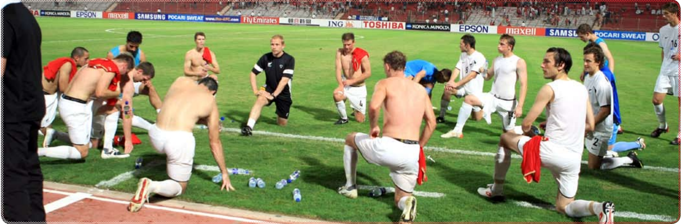
صور من المباراة

ما ينفع إهدار الفرص بالأحمر ندامة روح بعزم «ولينغ تون» وانسى حسرة المنامة