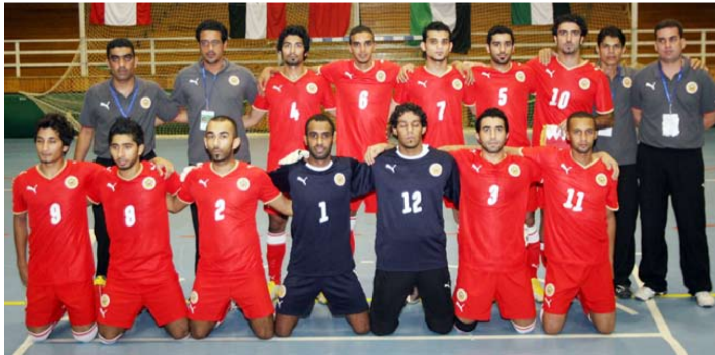
منتخب البحرين لكرة الصالات

وفي ختام حديثه، وجه الغنيم جزيل شكره للاتحاد البحريني لكرة القدم ورئيس لجنة كرة القدم الشاطئية والصالات الشيخ علي بن خليفة آل خليفة على دعمه لهذا المنتخب الحديث ووقوفه إلى جانب اللاعبين والاطمئنان على أوضاعهم قبل المشاركة في البطولة، متمنياً بأن يتمكن اللاعبون من رد الجميل بتحقيق مركز مشرف. كما وجه الغنيم شكره للأندية التي تعاونت مع إدارة المنتخب في عملية تفريغ اللاعبين للمشاركة في هذه البطولة.