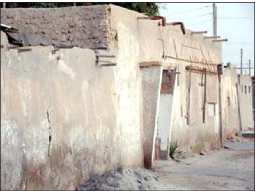
المنازل المتضررة من توقف مشروع «الآلية للسقوط»

الواسعة، والتي تساعد القوارض والفئران والقطط اللوج والآنخراط المزري بكثرة داخله واتخاذهم إياه مسرحاً مفتوحاً للتكاثر والتنامي السريع.