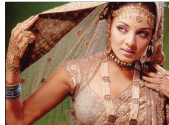
النجمة الهندية سيلينا جيتلي

□ أعلن مهرجان القاهرة السينمائي الدولي عن مشاركة النجمة الهندية سيلينا جيتلي في فعاليات دورته الخالصة والثلاثين التي تقام في الفترة من 10 إلى 20 نوفمبر/ تشرين الثاني المقبل.