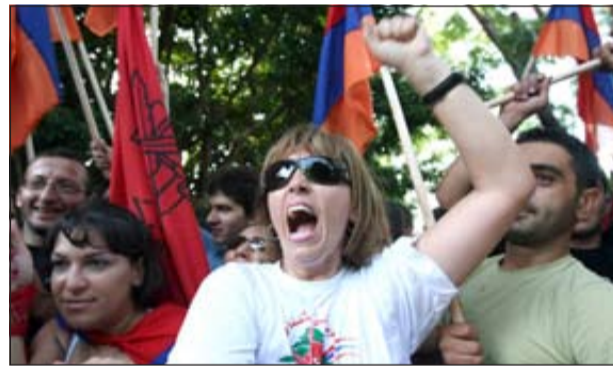
مظاهرة للطلّاشناق في بيروت ضد الاتفاقية التركية الأرمينية

وقال مسؤولون من البلدين السبت، مازال يتعين بعد توقيع الاتفاقية أن يقرها برلمانا البلدين في مواجهة معارضة من القوميين في الجانبين وارمن الشتات الذين يتمتعون بنفوذ قوي ويصرون على اعتراف تركيا بأن عمليات قتل الأرمن كانت إبادة جماعية.