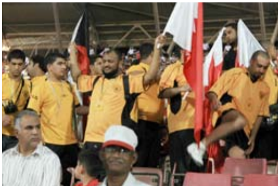
قليلة دخلت المدرجات ذاتها مجموعة من جماهير القادسية الكويتي الذي وعد رئيس النادي بإيفادها للبحرين للوقوف خلف المنتخب الوطني.

□ حرص مجموعة من الأشقاء الكويتيين على الحضور بالأمس لمؤازرة المنتخب الوطني، ووصلت هذه المجموعة قبل نصف ساعة من انطلاق المباراة ولاقت ترحيباً حاراً جداً من قبل الرابطة في المدرجات على يمين المنصة الرئيسية، وكانت ترتدي اللباس الأزرق الخاص بالمنتخب الكويتي وحملت أعلام الكويت في بادئة مجموعة من جماهير القادسية الكويتي الذي بدأت المباراة بدقائق