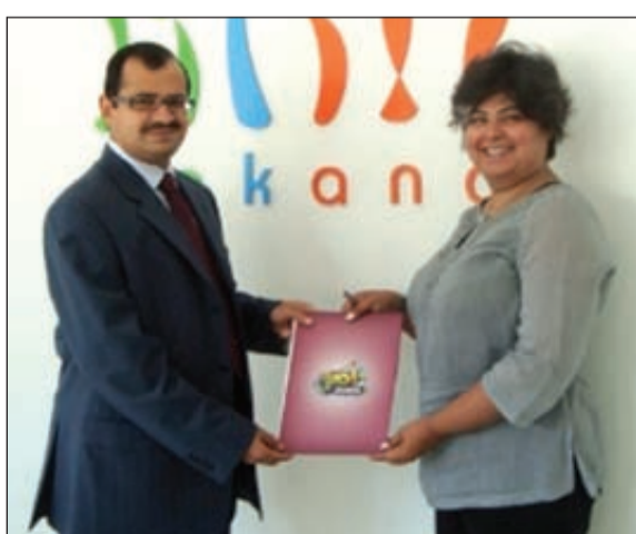
«سكنا» ترعى مسابقة مهرجان الشباب الجامعي

□ أكدت شركة «سكنا» للحلول الإنسانية المتكاملة عن رعايتها لمسابقة «YO: M-AD» وهي مسابقة خلاقة تطلب من العقول الشبابية المبدعة تصميم إعلان للعلامة سكنا التجارية في مهرجان الشباب الجامعي «YO: 09»، وهو أول مهرجان شبابي في البحرين لطالب الجامعات البحرينية. ومن المتوقع أن تشارك أكثر من 10 جامعات في المهرجان الذي سيستمر ليومين والذي تنظمه شركة «أوت أوف ذي بوكس» وتستضيفه جامعة نيويورك للتكنولوجيا في البحرين خلال اليومين 14 و 15 من نوفمبر/ تشرين الثاني 2009.