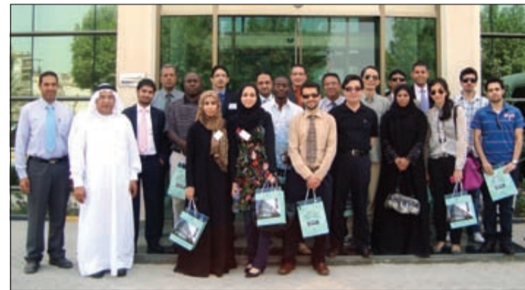
الوفد أثناء الزيارة

□ قام وفد يضم عدداً من المسؤولين في عدد من شركات التأمين العربية والأجنبية بزيارة استطلاعية لمنشآت شركة «البحرين لسحب الألمنيوم» (بلكسكو)، استمعوا خلالها إلى شرح مفصل حول تاريخ ومجالات عمل الشركة ومرافقها المختلفة، وتلى ذلك عرض لفيلم وثائقي يتناول الجوانب الفنية من عمل الشركة ومسيرتها وأسواقها.