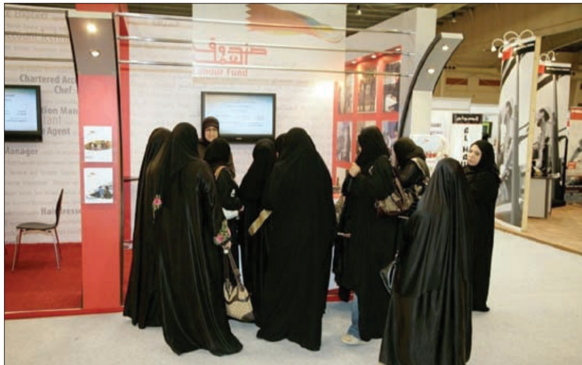
صندوق العمل يوفر برامج لتدريب وتحسين الموارد البشرية إضافة إلى المؤسسات الاقتصادية