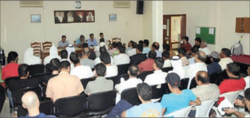
العمال يخولون النقابة لاتخاذ قرار الإضراب عن العمل