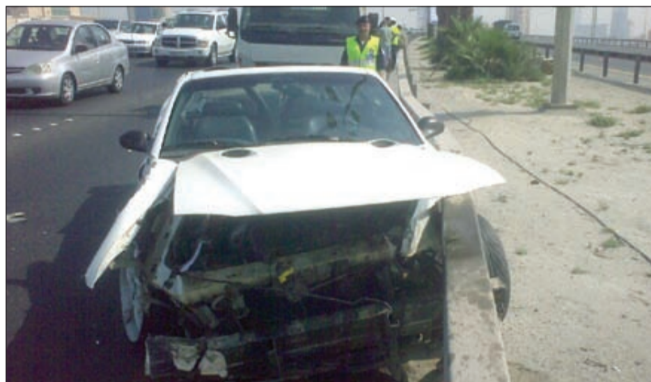
السيارة بعد استقرارها في السياج الحديدي