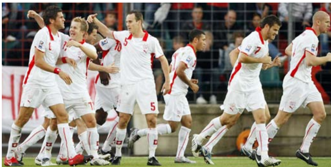
فرحة لاعبي سويسرا بالهدف الثالث

وفقد المنتخبان أي أمل في المنافسة على بطاقة التأهل المباشر إلى النهائيات بعدما ضمنت إنجلترا متصدرة المجموعة مشاركتها في العرس الكروي الصيف المقبل، وهي تتلقى لاحقا مع مضيفتها أوكرانيا التي تتنافس مع كرواتيا على المركز الثاني.