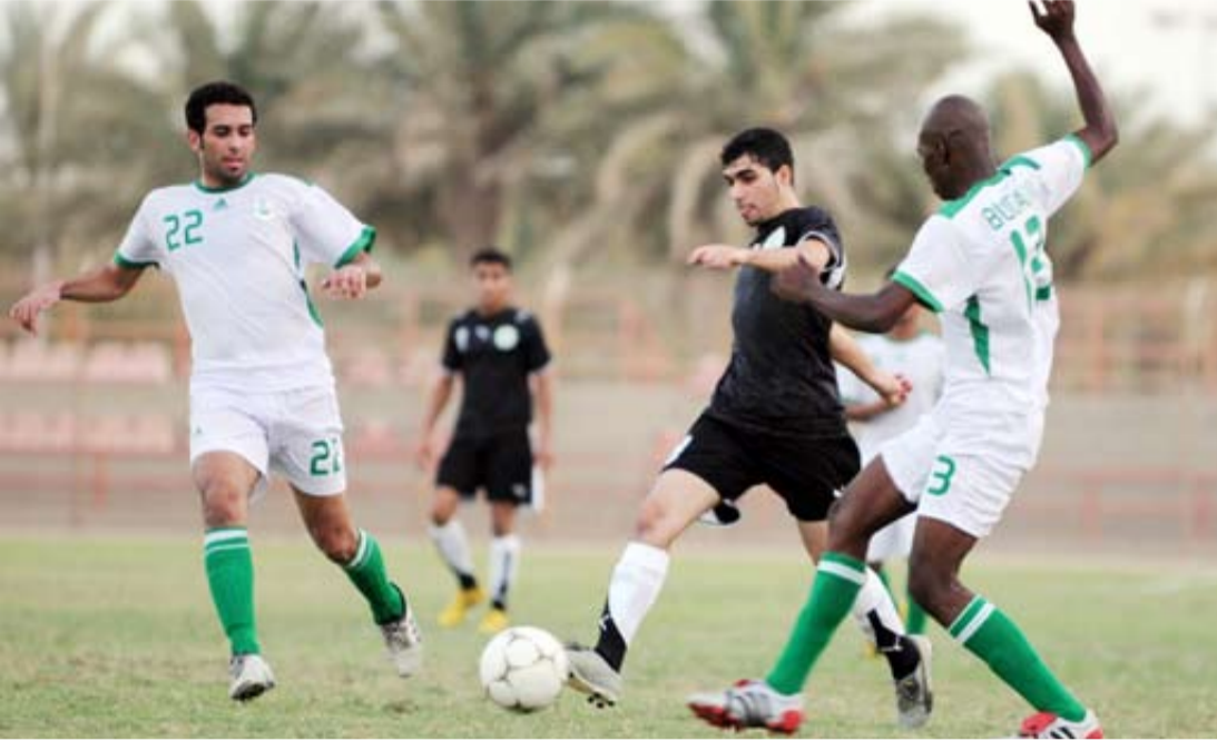
من منافسات دوري الدرجة الثانية

اهداف نظيفة وقدم مباراة جيدة وظهر من خلالها لاعبو الفريق بمستوى فني جيد اهلهم للفوز على التضامن. ويأمل اليوم لمواصله نتائج الإيجابية والتقرب لمنطقة الصدارة وخصوصا انه لن يغيب في الجولات المقبلة لوقوفه في الجولة الأولى، ومن المتوقع ان يظهر الحد بمستوى فني جيد نظراً لما يتمتع به لاعبه من مهارات جيدة تساعدهم على الخروج ببقا المباراة، فهل يواصل الحد نتائج الإيجابية أم ستكون هناك كلمة أخرى لمدينة عيسى؟