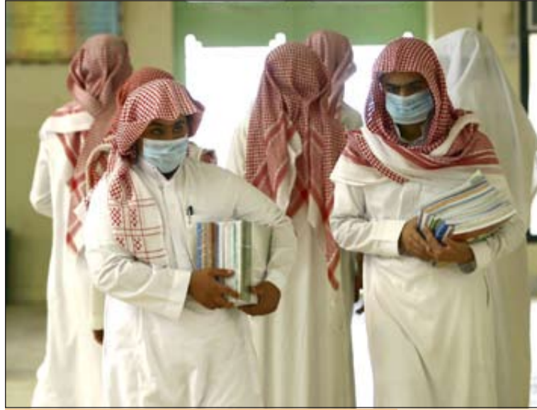
طالبة سعوديون يرتدون أقنعة واقية خوفاً من انفلونزا الخنازير