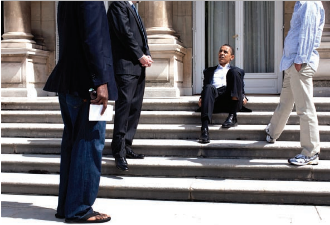
أوباما يتحدث مع مستشاريه في البيت الأبيض

وقد أكدت لجنة نوبل النرويجية أمس الأول (الجمعة) على «الجهود الخارقة» التي بذلها أوباما «بغية تعزيز الدبلوماسية الدولية والتعاون بين الشعوب». لكن اختيار أول رئيس أميركي أسود يبلغ ثمانين وأربعين عاماً يبدو بالنسبة إلى أهل الصحافة مثقراً للدهشة والجدل في آن.