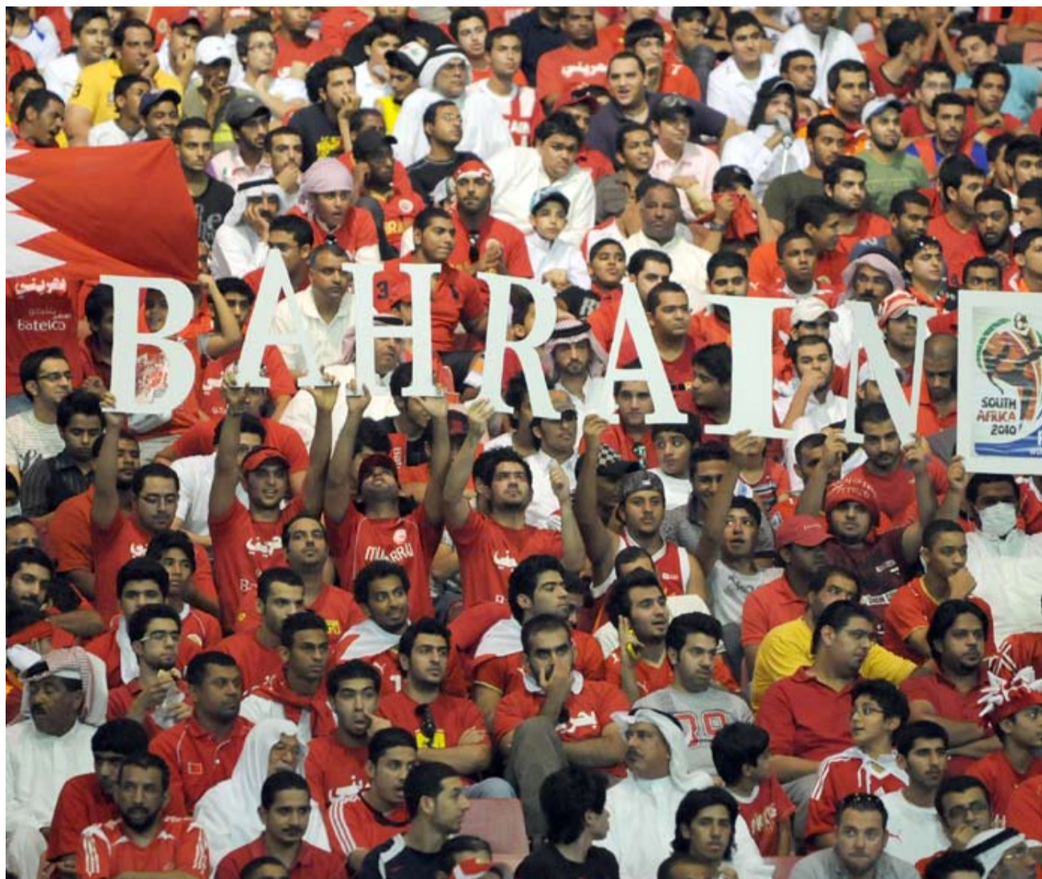
الجماهير البحرينية الوفية رفعت اسم بلادها أمام منتخب نيوزيلندا أمس

□ لكن نتمنى أن تخرج مباراة منتخبنا الوطني أمام منتخب نيوزيلندا بنتيجة نظيفة من دون أن نسجل هدف الفوز الذي يعطينا حافزاً أكبر في مباراة العودة التي ستقام على أرض لم نعرفها وأجواء لم نتعود عليها وظروف مغايرة علينا. تكاد تكون مغايرة لكل الظروف الطبيعية التي نعاشها، وهو الأمر الذي وضع جلياً على أعين منتخب نيوزيلندا الذين كانوا يشعرون بصعوبة ظروفنا. نتيجة التعادل لم تكن عادلة لو قسناها بجملته الأهداف الضائعة التي تاهت بين أرجل حسين بيليه وسلمان عيسى وجيسى جون ومحمد سيدعدنان. ولو وقف معنا الحظ في لعبة واحدة لخرج منتخبنا فائزاً ولكن هذه مشيئة أقدامنا لأنها ضلت الطريق وصعبت الموقف في مباراة