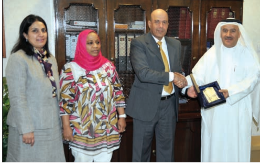
«بنك البحرين الوطني» يتسلم جائزته