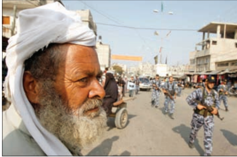
قوات أمن تابعة لـ«حماس» تقوم بدوريات في خان يونس

في الإطارات، طالبت شخصيات فلسطينية مستقلة أمس الفصائل بعدم تأجيل اتفاق المصالحة، وقالت الشخصيات، في بيان مشترك، إنها لا ترى ما يبرر التأجيل