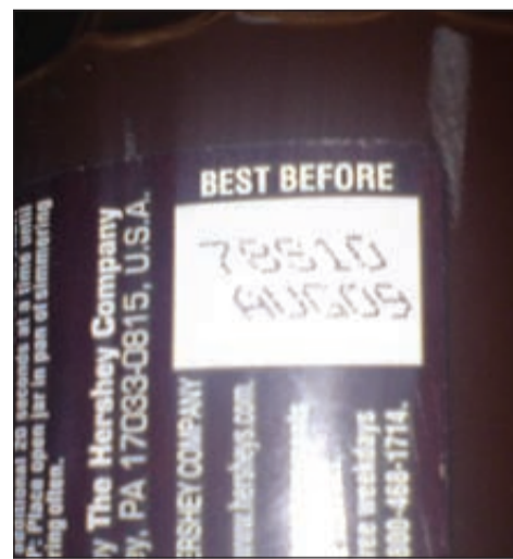
منتج منتهي الصلاحية بيع على أحد المواطنين

وطالب المواطن الجهات المعنية باتخاذ الإجراءات اللازمة مع التشديد على هذه البرادات والتأكد من المنتجات التي تباعها وخصوصاً أن بعض المواطنين لا يقومون بقراءة تاريخ انتهاء الصلاحية.