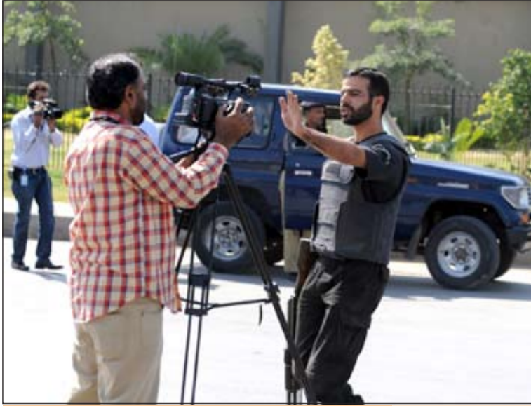
جندي باكستاني يجمع مصوراً تلفزيونياً من أداء عمله على إثر الهجوم التي تعرضت له قاعدة تابعة للجيش