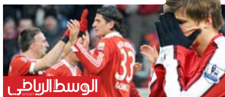
الوسط الرياضي أرسنال يتحدى الإصابات في مواجهة بورنموث والبايرن ميونخ في دورتها