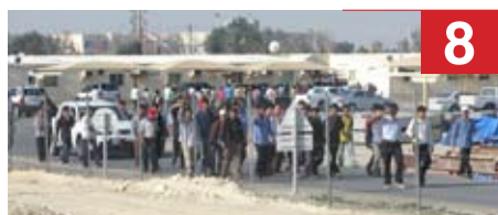
8 عمال جسور مدينة عيسى يجددون إضرابهم لتأخر أجورهم 4 أشهر