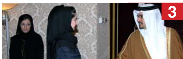
3 ولي العهد: تأهيل العاطلين أثبت نجاحه وعلى الشباب الصبر والمثابرة