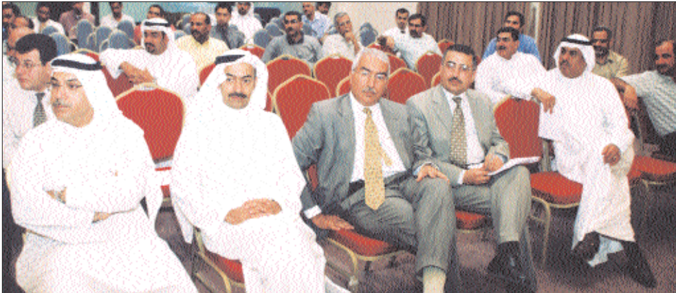
جانب من المهنيين الحاضرين للندوة