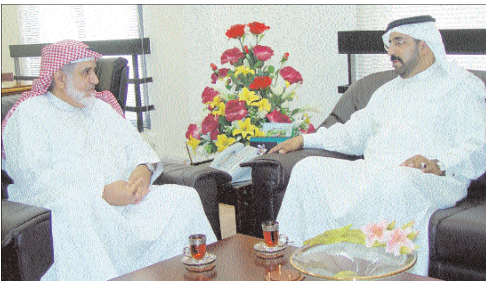
الشيخ سلمان بن عيسى آل خليفة في حديث مع احمد سلوم