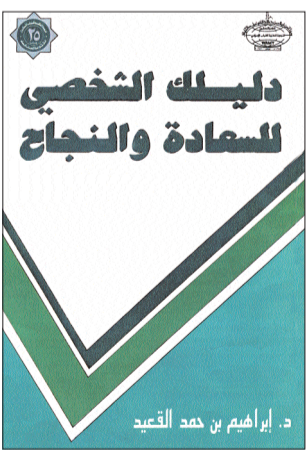
كتاب «دليلك الشخصي»

الدليل تدرج تحت مجالات عدة في علوم النفس والإدارة والتربوية والاجتماع وغيرها. المؤلف يتطرق إلى سر السعادة والنجاح، ثم يوضح كيفية تحديد الأهداف وتحققها وإلى الإدارة الفعالة للذات. بعد ذلك يتناول بالشرح عدة مهارات كالإتصال ومهارة حل المشكلات وصنع القرارات والتعامل مع الفشل. وغير ذلك من الموضوعات المهمة للادعية وطالب النجاح لأنها كلها تتكلم في صميم التعامل مع الذات والعلاقات مع الناس وسائر مستجدات الحياة.