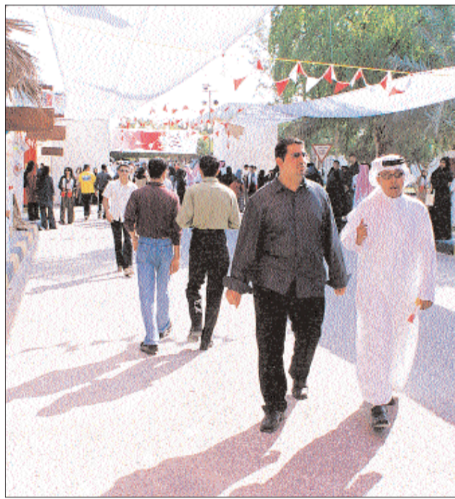
جامعيون وتخصصات تتناسب والسوق

بينما يراها الآخرون صعبة؟ ما هي نقاط قوتك؟ وما هي نقاط ضعفك؟ ربما يمكنك فهم كيفية عمل برامج الكمبيوتر، أو يمكنك تركيب دراجة هوائية من نظرة واحدة فقط لدليل التركيب.