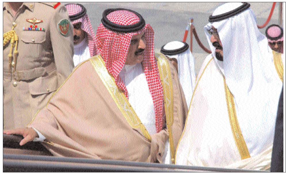
ولي العهد السعودي مودعا الملك المفدى على سلم الطائرة