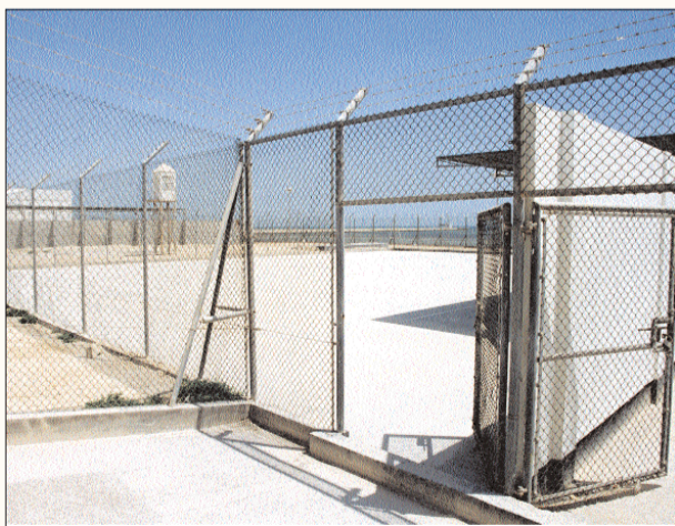
مدخل سجن جو المركزي

□ نفى مدير إدارة المؤسسات العقابية في وزارة الداخلية العقيد عبدالرحمن المرخي صحة الشكوى التي ذكرها نزلاء «سجن جو المركزي» عن عدم فصل النزلاء المصابين بأمراض معدية مثل: الإيدز والتهاب الكبد الوبائي عن النزلاء الأصحاء، ما يعرض النزلاء للأصابة بأمراض خطيرة، مؤكداً على ان كل نزيل يخضع للفحص الطبي بمجرد دخوله السجن، وإذا تبين من الفحص أصابته بمرض معدٍ يعزل في مبنى العزل الصحي المخصص لهذه الحالات، وقال: «نقوم بعزل هؤلاء المرضى حفاظاً على صحة النزلاء وعلى العاملين في السجن، ولكن سبب هذه الشكوى تكمن في أننا - بناء على تعليمات الطبيب - لا نعزل حاملي مرض الإيدز، أو المصابين بأحد أنواع التهاب الكبد الوبائي الذي لا ينتسب في عدوى، وعلى رغم تأكيدنا الدائم للنزلاء ان هؤلاء المرضى لا خوف منهم، فإن الخوف يجعلهم يعتقدون أننا نهمل في حمايتهم، بينما الحفاظ على سلامتهم يعني الحفاظ على سلامتنا: أننا نتعامل معهم وبشكل مباشر».