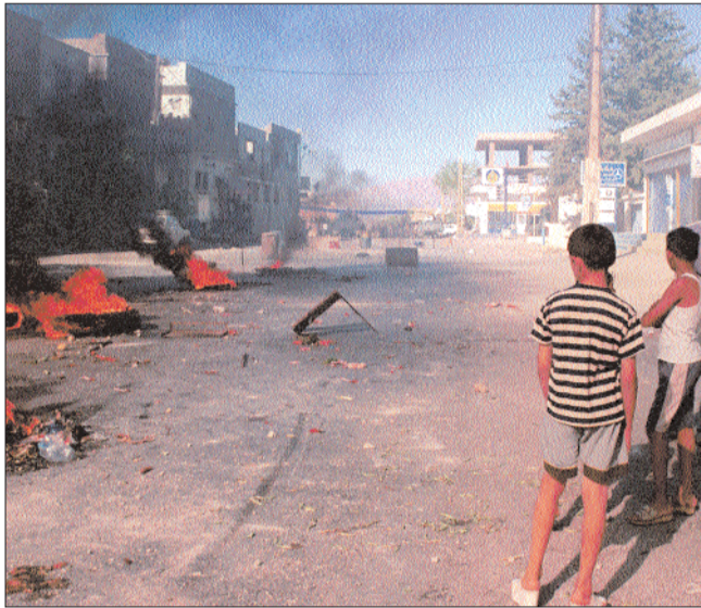
اطارات مطاطية تحترق في شوارع بعلبك بعد الاشتباك المسلح

وزير الدفاع بكري حسن صالح، ومحكمة رئيس الاركان ورئيس العمليات بنهمه «الاهمال» لانها سمحت قوات قرق بالاستيلاء على اهم مدينة استراتيجية في الجنوب وتعتبر عسكرياً من الخطوط الدفاعية الرئيسية لحماية عاصمة الجنوب، جوبا. وتكررت تلك الجهات السياسية ان انسحاب الوفد السوداني من المفاوضات هو اجراء «متهور» لان واشنطن لن تسمح به حتى لو اضطرت الى اسقاط نظام الانقاذ. وجاء كذلك تغطية لفضح القوات العسكرية في الدفاع عن موقعها وهو امر يزيد من تعقيدات الوضع الداخلي في الخرطوم. وفي الختام قالت المصادر السياسية السودانية ان الهجوم الذي قامت به قوات قرق هو «رد غير مباشر على هجوم قامت به القوات السودانية لمنطقة (اعالي النيل) اثناء مفاوضات الجولة الاولى، وآنذاك لم ينسحب قرق من المفاوضات» (تفاصيل أخرى ص 11)