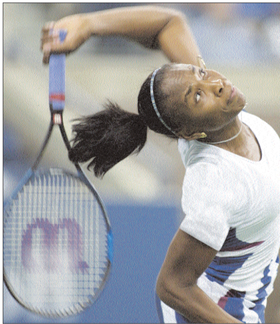
فينوس توجه احدث ارسلاتها

ويلتقي هويت في الدور المقبل مع الأميركي اندريه اغاسي السادس التي تخلص من عقبة البيلاروسي ماكس ميرنيي 6 - 7 (5 - 7) و 6 - 3 و 7 - 5 و 6 - 3.