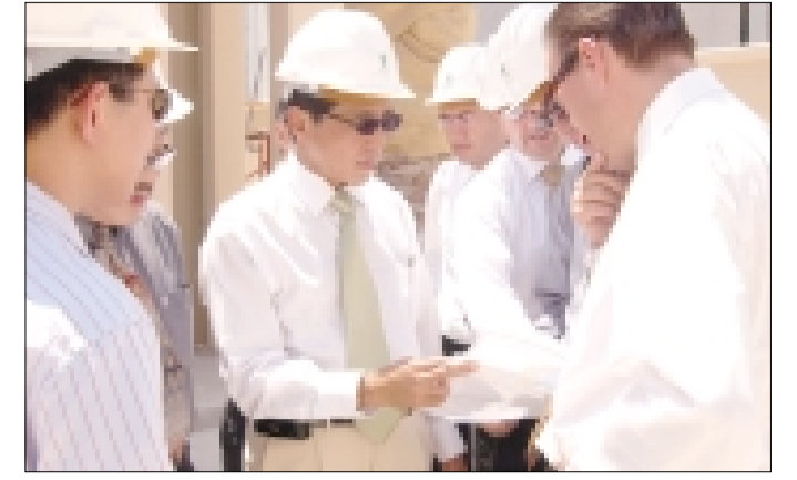
مؤكوان بينين يناقش المشروع مع المهندسين