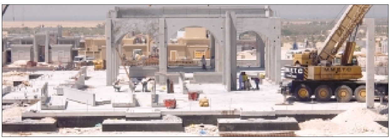
أعمال الانشاءات مستمرة في فندق ومنتج «بنيان تري»

وأوضح: «على رغم فرص النمو المتميزة التي توفرها منطقة الشرق الأوسط، فإن الكثير من الشركات الغربية لاتزال تطلق على المنطقة أحكاماً مسبقة خاطئة، وفي الوقت الذي تزاول فيه شركات عالمية كبرى متخصصة في مجال العلاقات الإعلامية نشاطها في أسواق المنطقة، إلا أن أياً منها لم يعط المنطقة حقها حتى الآن».