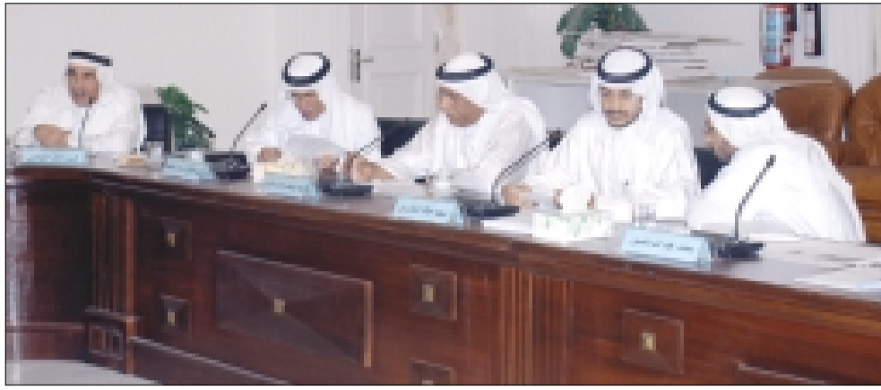
جانب من اجتماع بلدي المنامة يوم أمس