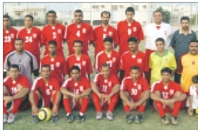
فريق وزارة شؤون البلديات