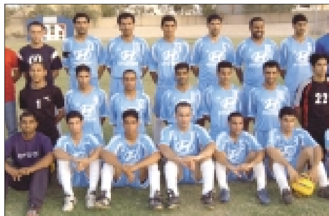
فريق استثمارات الزياني