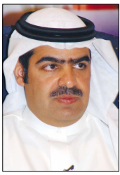
الشيخ فواز بن محمد

* 12 أغسطس: تحت رعاية رئيس المؤسسة العامة للشباب والرياضة الشيخ فواز بن محمد آل خليفة تقيم إدارة شؤون الشباب حفلاً بمناسبة اليوم الدولي للشباب تحت شعار «شباب... معطاء» وذلك في الساعة 8,30 من مساء اليوم (السبت) بقاعة المؤتمرات بفندق كراون بلازا.