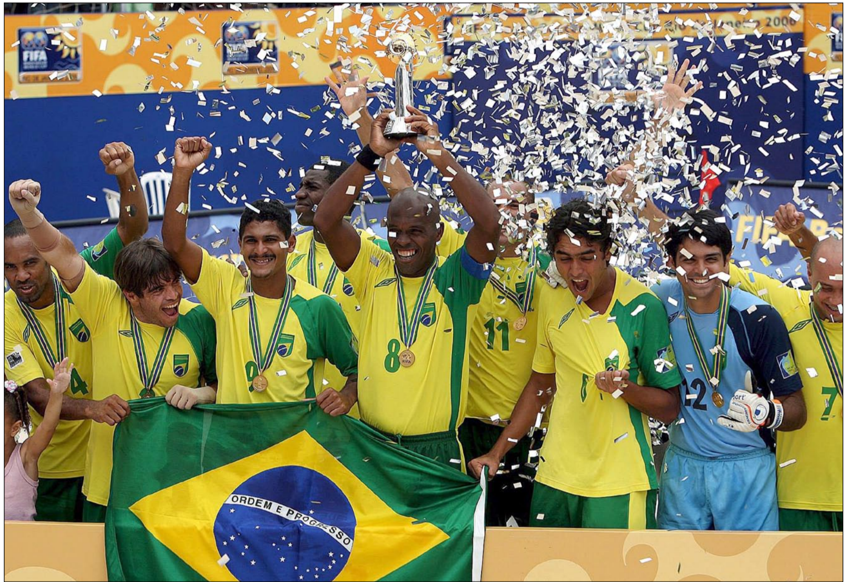
منتخب البرازيل بطل كأس العالم لكرة القدم الشاطئية على منصة التتويج