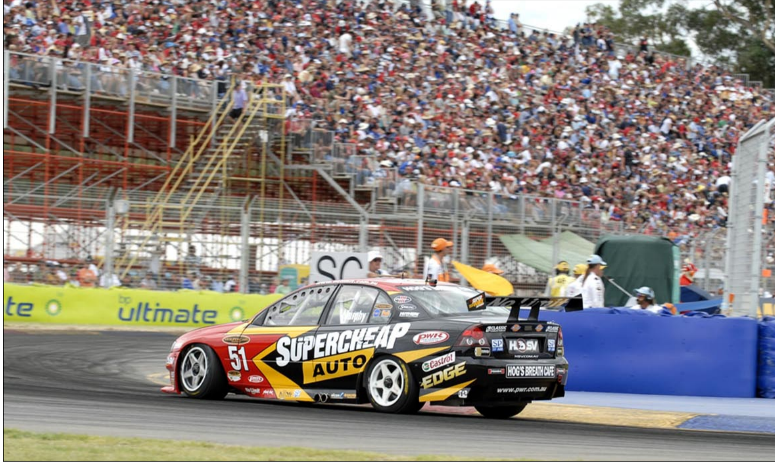
حضور جماهيري كبير يعبر عن الشعبية الواسعة لسباقات الـ V8 في استراليا

□ عرف الشعب الأسترالي بحبه وشغفه الكبيرين للرياضة الخطرة والمغامرات، حتى بات الألعاب الرياضية التي تصنف من هذين النوعين هي الأكثر شعبية في القارة الأسترالية، وقد فاقَت شعبيتها كرة القدم اللعبة الأكثر شعبية على المستوى العالمي.