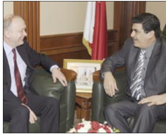
البحارنة مستقبلاً مدير عام «اليونيدو»

(الثلاثاء) سفير مملكة السويد غير مقيم لدى مملكة البحرين برونو ستيفان بيبار، العلاقات الثنائية بين البلدين الصديقين وسبل تطويرها في جميع المجالات، وخاصة في المجالات التجارية والاقتصادية والفنية.