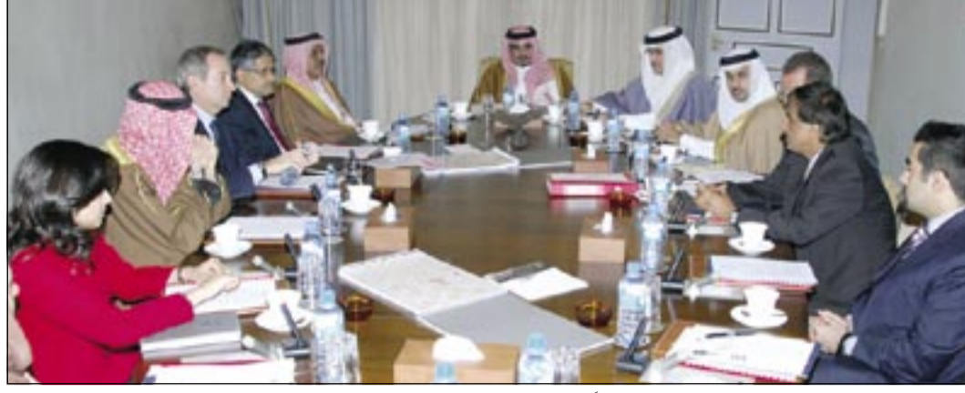
سمو ولي العهد مترشحاً اجتماع مجلس إدارة برنامج المنح الدراسية العالمية

هذا وناقش الاجتماع أيضاً عدداً من الموضوعات المدرجة على جدول أعمال الاجتماع وخاصة ما يتعلق منها بالشؤون المالية والموازنات المقررة لمختلف أنشطة البرنامج واستمع المجلس الى تقرير مستفيض في هذا الشأن.