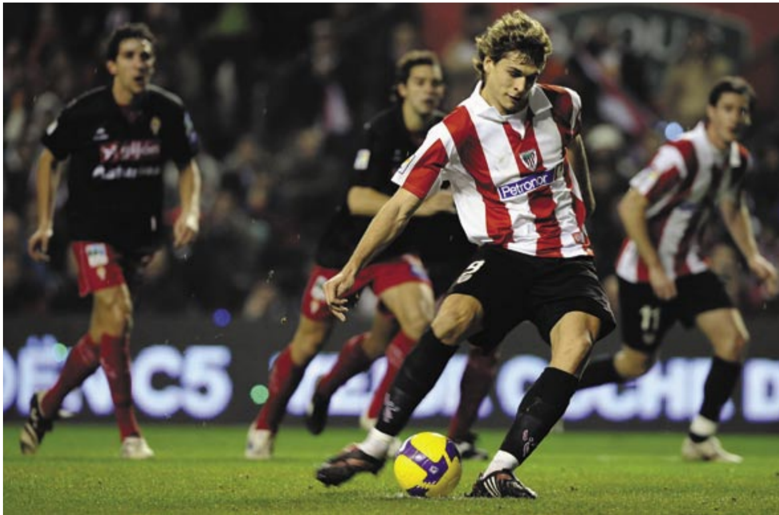
لورينتي الورقة الرابعة للفريق بيلباو أمام إشبيلية

وفي مباراة الذهاب الأخرى بقبل نهائي الكأس غدا (الخميس) يحل ريال مايوركا ضيفا على برشلونة متصدرا الدوري بعدما حقق فوزا معنويا بهدف من دون مقابل على مضيفه أوساسونا لبيتعد عن قاع المسابقة. وأكد مهاجم برشلونة الفرنسي تييرى