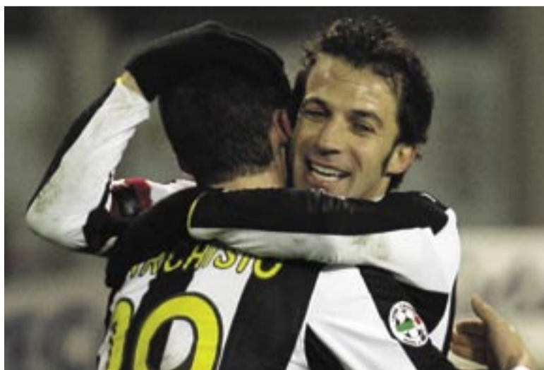
يوفنتوس يأمل استعادة انتصاراته المتوقفة

وتخلى فريق المررب كلاوديو رانيري عن مركزه الثاني لمصلحة قطب مدينة ميلانو الآخر ميلان بعد فوز الأخير على لاتسيو 3/ صفر، ما يعني أن يوفنتوس سيصعب اهتمامه على مسابقة الكأس ولن يعتبرها «هامشية» لأنها قد تكون فرصته الوحيدة للخروج فائزا بأحد الألقاب هذا الموسم، خصوصا أنه يواجه تشلسي الإنجليزي في نمن نهائي مسابقة دوري أبطال أوروبا. ويأمل يوفنتوس أن يتخطى عقبة نابولي الذي يمر بدوره بفترة صعبة في الدوري، كي يحصل على فرصة الظفر بلقب هذه المسابقة للمرة الأولى منذ العام 1995 عندما تغلب حينها على بارما 1/ صفر ذهابا و2/ صفر إيابا، والانتفاز مجددا بالرقم