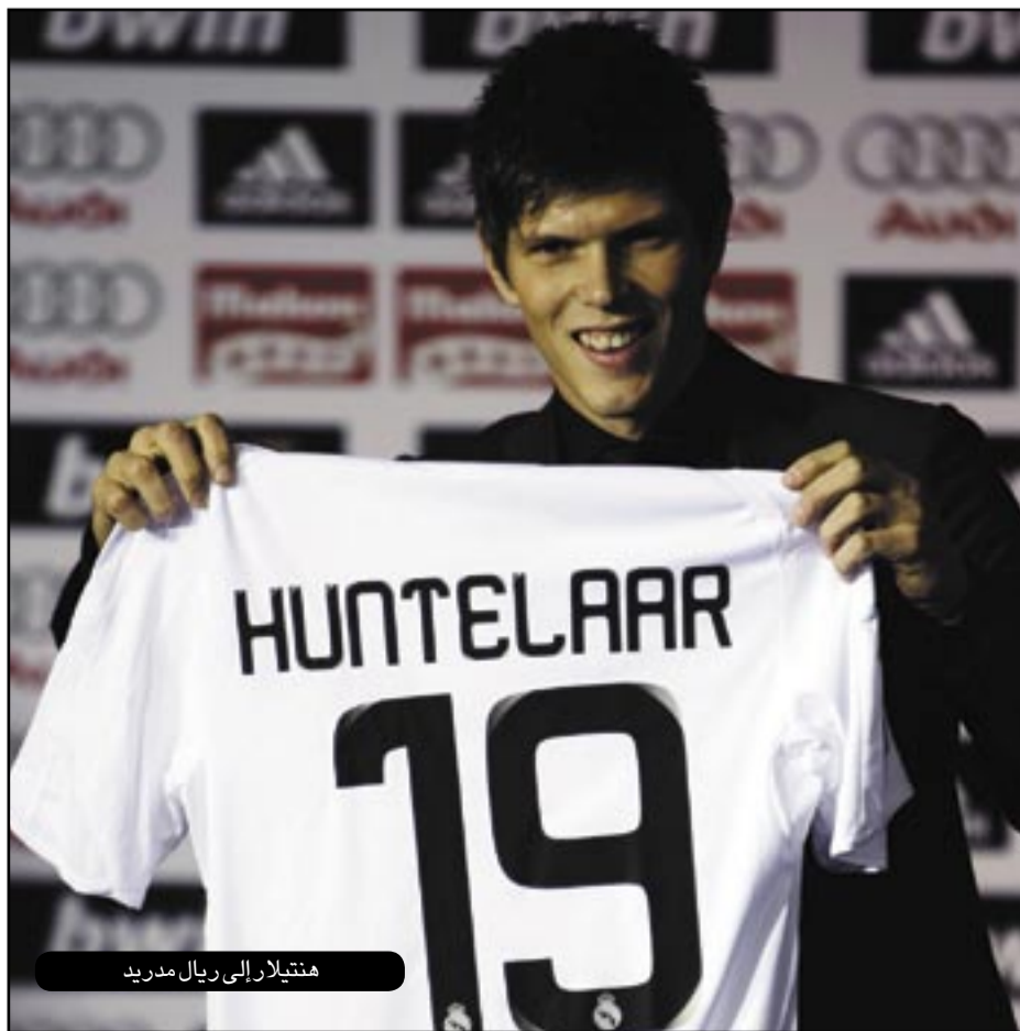
هنتيلار إلى ريال مدريد

واستغنى بورتسموث عن ديفو لتوتنهام وإلسانا ديارا لريال مدريد الإسباني في يناير / كانون الثاني الماضي لكنه ضم انجيلوس باسيناس الفائز مع منتخب اليونان بكأس الأمم الأوروبية العام 2004 من أجل تدعيم فرصه في تفادي شبح الهبوط للدرجة الثانية.