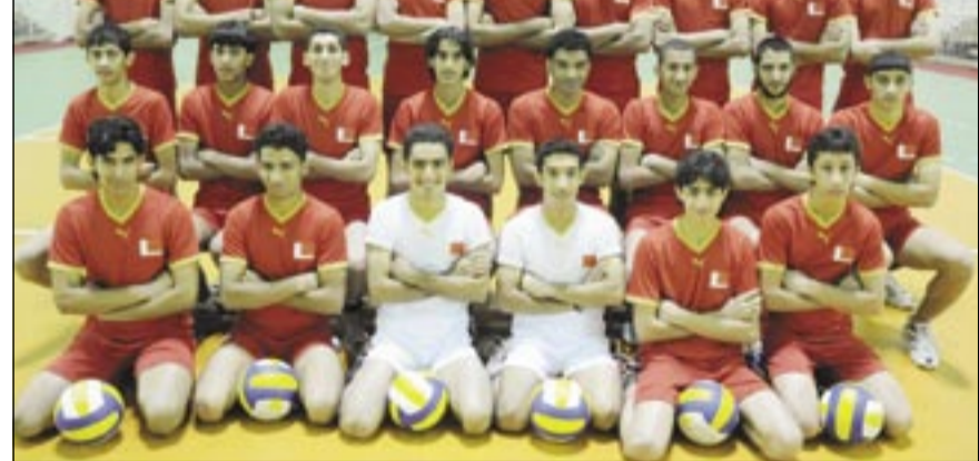
منتخب الناشئين لكرة الطائرة

يذكر أن البطولة ستبدأ من 5 إلى 7 فبراير، وسيخوض كل منتخب (3) مباريات.