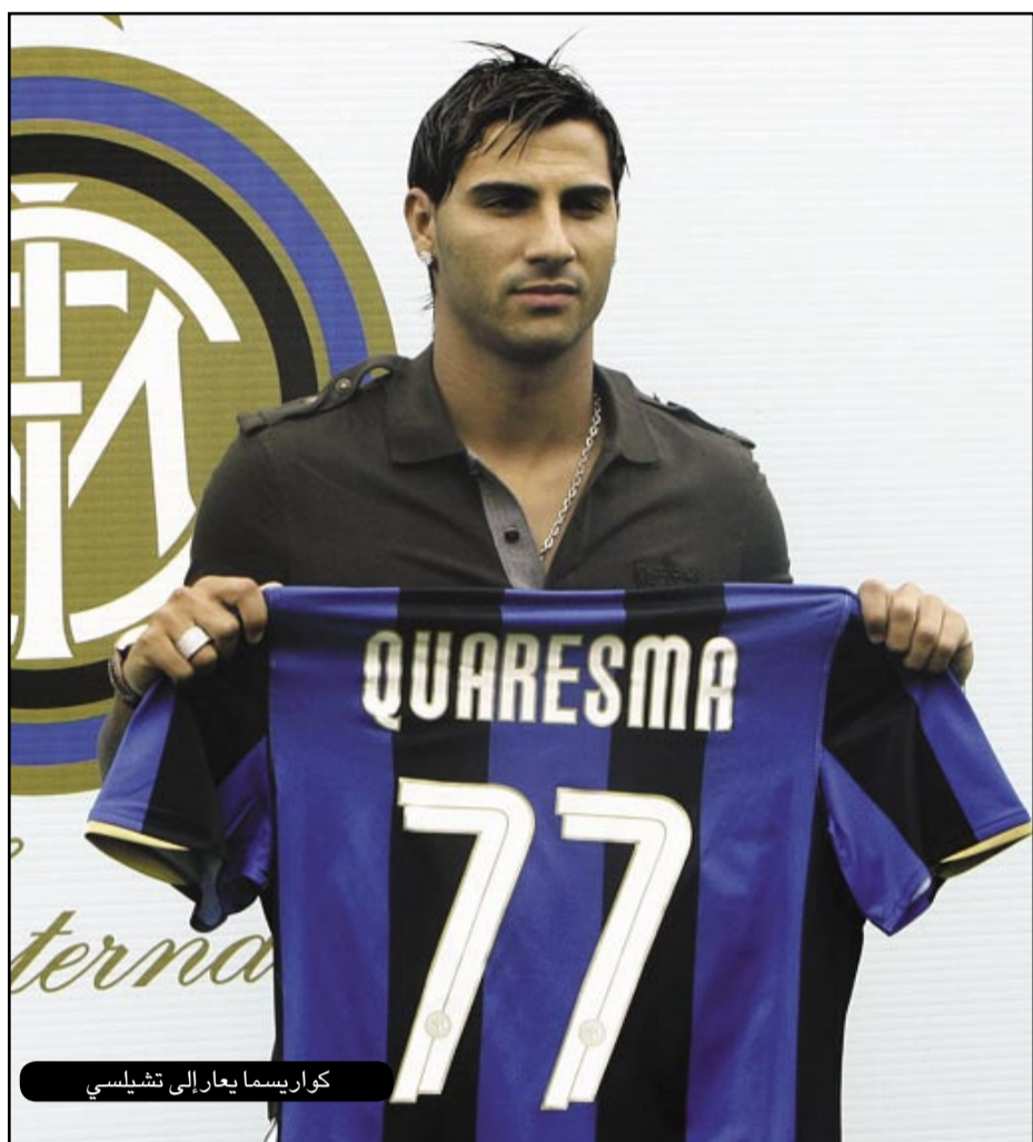
كوارييسما يعار إلى تشيلسي