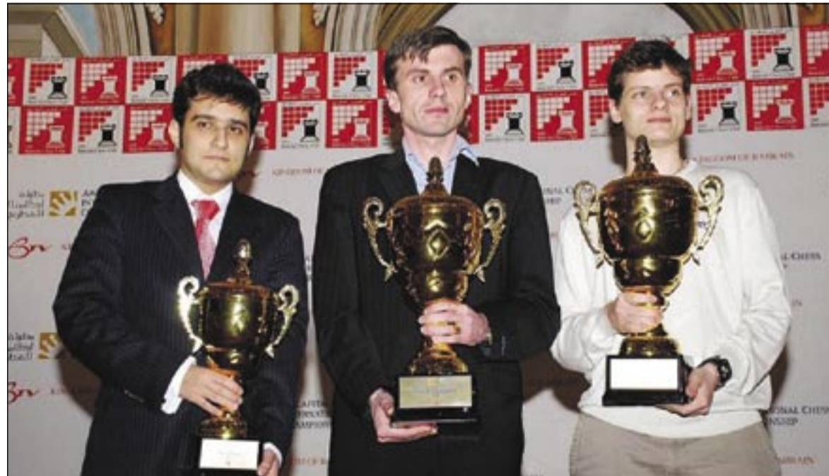
الفائزون بكأس بطولة أركابيتا الدولية للشطرنج

واستطاع اللاعب البلجيكي فاديم مالاخاتكو من تحقيق سبع نقاط ونصف وحصل على الجائزة المالية المرصودة للمركز الأول وقدرها أربعة آلاف دولار أميركي، ويعد اللاعب البلجيكي من المشاهير بأدائهم القتالي ومن نقاط قوته أنه يصعب تحديد نقاط ضعفه وبدأ لعب الشطرنج بجدية بعد متابعته مباراة بين البطل السوفيتي جاري كاسباروف مع خصمه أناتولي كاربوف في بداية التسعينيات، وكان البلجيكي مالاخاتكو (33 سنة) أوكراني المولد يحتاج إلى التعادل فقط مع أقرب منافسيه البلغاري إيتوف فالنبتين لضمان كسب البطولة، كما كان هو الحال مع الثاني لضمان المركز الوصيف للبطولة، وقد ظهرت النتيجة بقبول الطرفين للتعادل مبكراً لترك ساحة التنافس على أشدها للاعبين الذين سيلحقون بالبطل والوصيف في قائمة الترتيب الثماني الأوائل الآخرين المستحقين للجوائز النقدية والتي تبلغ ستة عشر ألف دولار أميركي، فقد حقق اللاعب الدولي الإيراني البشان مرادبادي فوزاً مستحقاً ضد مواطنه الجردان ماستر أمير باقري ليحقق باللاعب البلغاري إيتوف فالنبتين برصيد سبع نقاط، إذ وضعه نظام كسر التعادل في المركز الثالث بعد البلغاري إيتوف وليتقاسم معه مجموع الجائزة المالية للمركزين الثاني والثالث حيث حصل