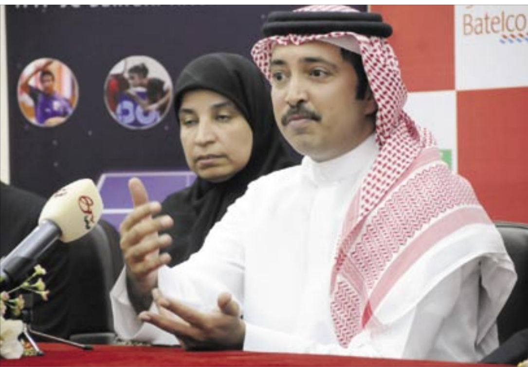
من المؤتمر الصحافي لإعلان الرعاية

العالم، ونحن بدورنا كشركات راعية نساهم في دعم هذه الأنشطة والبطولات التي من شأنها دعم المجتمع البحريني ورفع شأن شبابه، وهي سياسة متفق عليها في شركتنا في دعم الأنشطة الرياضية والاجتماعية والثقافية التي تنصب في صالح الوطن، وهي مسئولية وطنية».