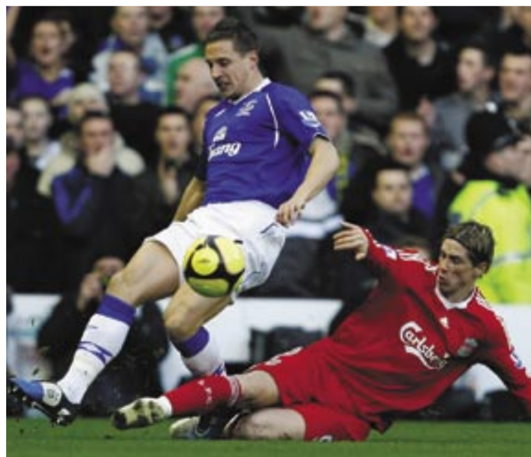
ليفربول وايغرتون يتواجهان مجددا

وكان توريس سجل هدفي فوز فريقه ضد ايغرتون عندما التقيا ذهابا في الدوري على ملعب «غوديسون» بارك في سبتمبر/ أيلول الماضي.