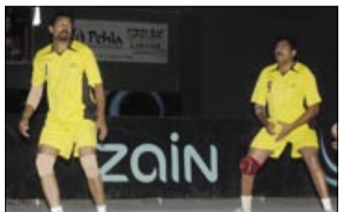
من منافسات الدورة

□ قدمت شركة «زين البحرين» مساندة الجهود أحد الأندية الرياضية المحلية في البلاد بغرض دعم الروح الرياضية بمناسبة الاحتفال بعيد الجمهورية الهندية، ما لقي تقديراً من جانب مشجعي ومحبي رياضة الكرة الطاولة.