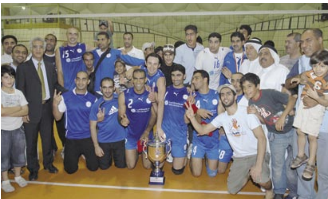
تتويج فريق النجمة الموسم الماضي

يعتبر فريق النجمة الفريق الأكثر تحقيقاً لمسابقة كأس رئيس المؤسسة للكرة الطائرة التي وصلت إلى نسختها الرابعة فقط وذلك بعدما حققها مرتين متتاليتين في موسمي 2006-2007 و2007-2008، الأولى كانت على حساب داركليب بنتيجة (3/صفر)، فيما كانت الثانية على حساب الغريم التقليدي في العاصمة نادي النصر بنتيجة (2/3) بعد مباراة ماثوئية، وفقد النجمة فرصة تحقيق اللقب للمرة الثالثة في تاريخه وذلك بعد خسارته في نصف النهائي هذا الموسم من المحرق بنتيجة (1/3). فيما يعتبر المحرق أول فريق يحقق البطولة منذ انطلاقتها وذلك في موسم 2006-2007 وشارك بعد فوزه في هذه البطولة شارك ببطولة آسيا للأندية في فينتام، وكان نظام البطولة آنذاك من جمع نقاطاً بين الفرق الأربعة الأولى للمسابقة. فيما كان لقب النجمة بالنظام الجديد وهو نظام المجموعتين ومن ثم نصف النهائي والنهائي.