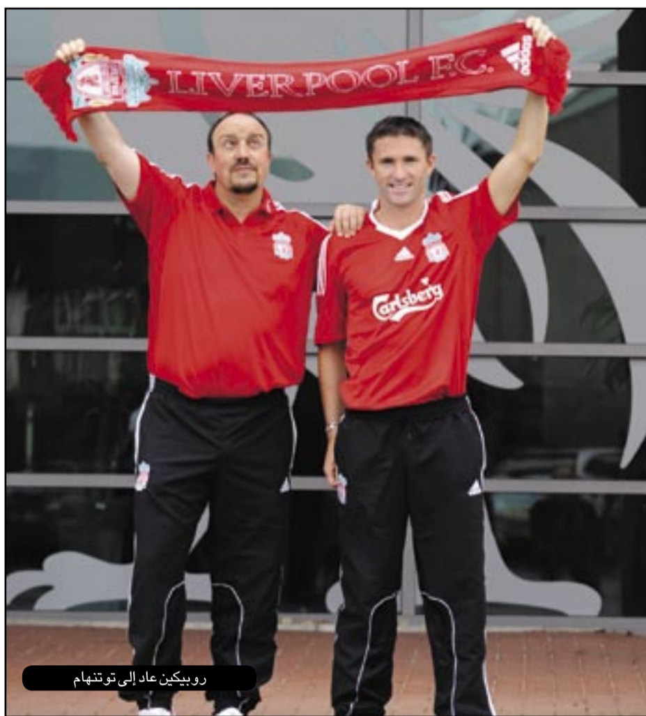
روبيكين عاد إلى توتنهام

جديد للغاية ولا يحتاج إلى تدعيم صفوفه. وانفق ريال مدريد أموالاً لشراء لاعب خط الوسط القوي ديارا مقابل 20 مليون جنيه إسترليني (28.62 مليون دولار) من بورتسموث إضافة إلى هنتيلار وهو مهاجم خطير من نوعية نجم ريال مدريد رود فان نيسلروي وذلك مقابل 20 مليون يورو (25.70 مليون دولار). ويمكن أن تنظر إلى الدوري الممتاز الإنجليزي لتجد أنه لا يوجد أي آخر يمتلك مثل هذه السيولة. وأعاد توتنهام ضم جيرمين ديفو من بورتسموث مقابل 15 مليون جنيه إسترليني (21.46 مليون دولار) وضحي كثيراً من أجل ضم ويلسون بالاسيوس من ويغان كما اشترى أيضاً مدافع فرنسا باسكال شيمبوندا من سنترلاند. ويمكن لامانشستر يونايتد الذي يجلس مرتبعا على قمة الدوري الممتاز الإنجليزي أن يتحمل تبعات رؤيته طويلة المدى بضم اثنين من اللاعبين الشبان الواعدين وهما زوران توستيتش وادم ليايتش من بارتيزان بلغراد مقابل 16 مليون جنيه إسترليني (22.89 مليون دولار).