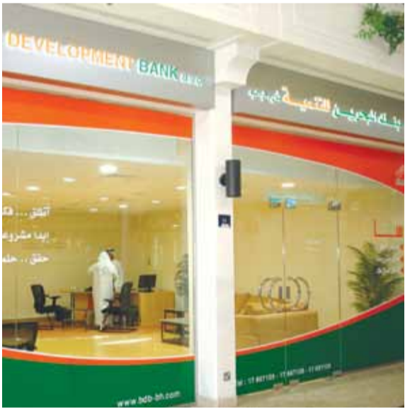
بنك البحرين للتنمية

و«BWA» شركة عالمية متخصصة في تطوير المواد والإضافات الكيميائية الخاصة بمعالجة المياه حيث تقوم بتزويد الأسواق المتخصصة في 90 دولة حول العالم. والملك الجدد لشركة BWA هم شركة استثمار عالمية مقرها الولايات المتحدة الأميركية ولديها استثمارات عدة في قطاعات مختلفة.