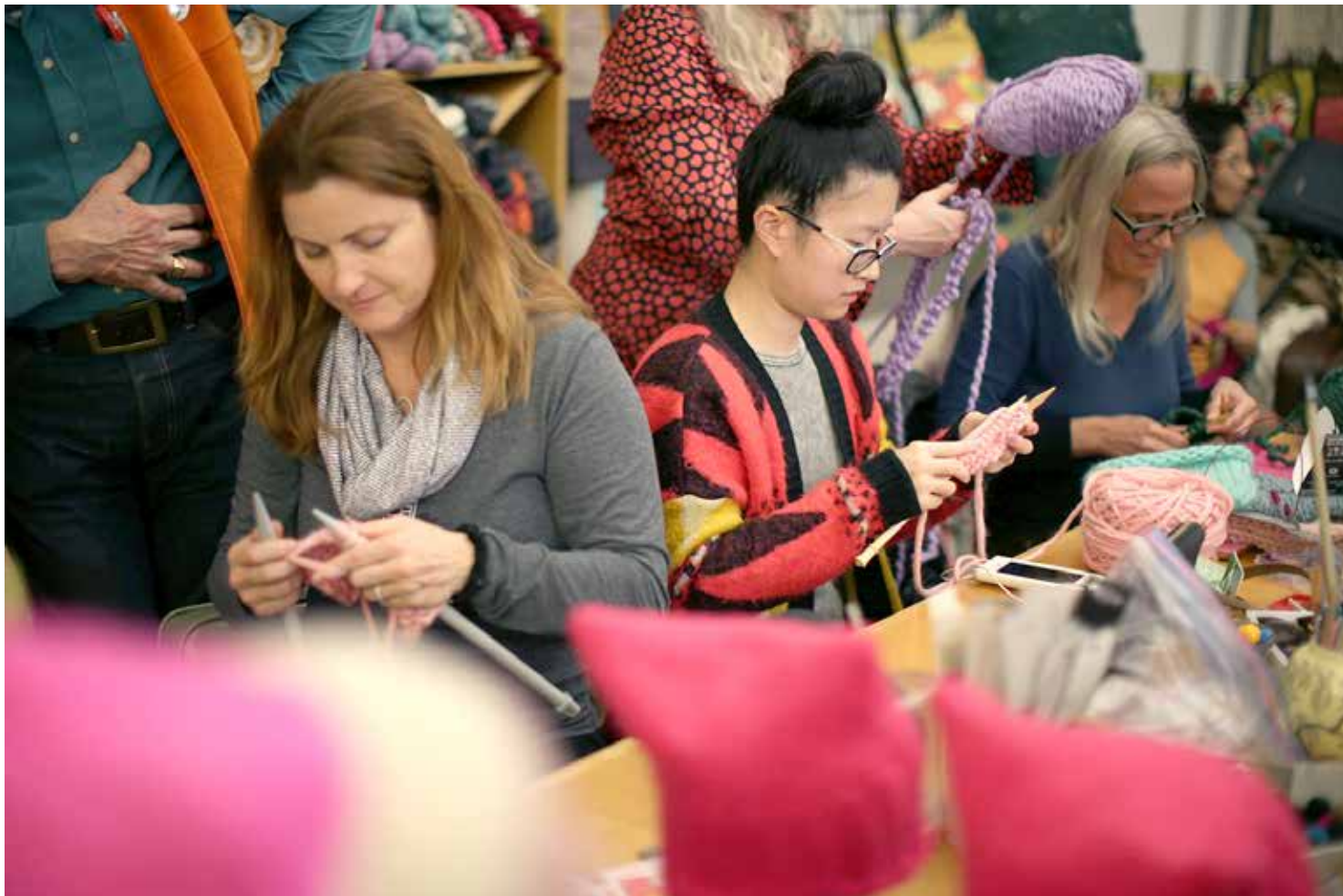
نساء يشاركن في صنع القبعات الوردية للمتظاهرين في مسيرة واشنطن العاصمة

فقد تسجل حوالي 190 ألف شخص حتى الآن على صفحة «فيسبوك» المخصصة للمسيرة على أنهم ينوون المشاركة فيها، فيما أبدى 253 ألفاً آخرين اهتمامهم. ومن الصعب التكهن بعدد المظاهرات الذين سيصدقون فعلاً