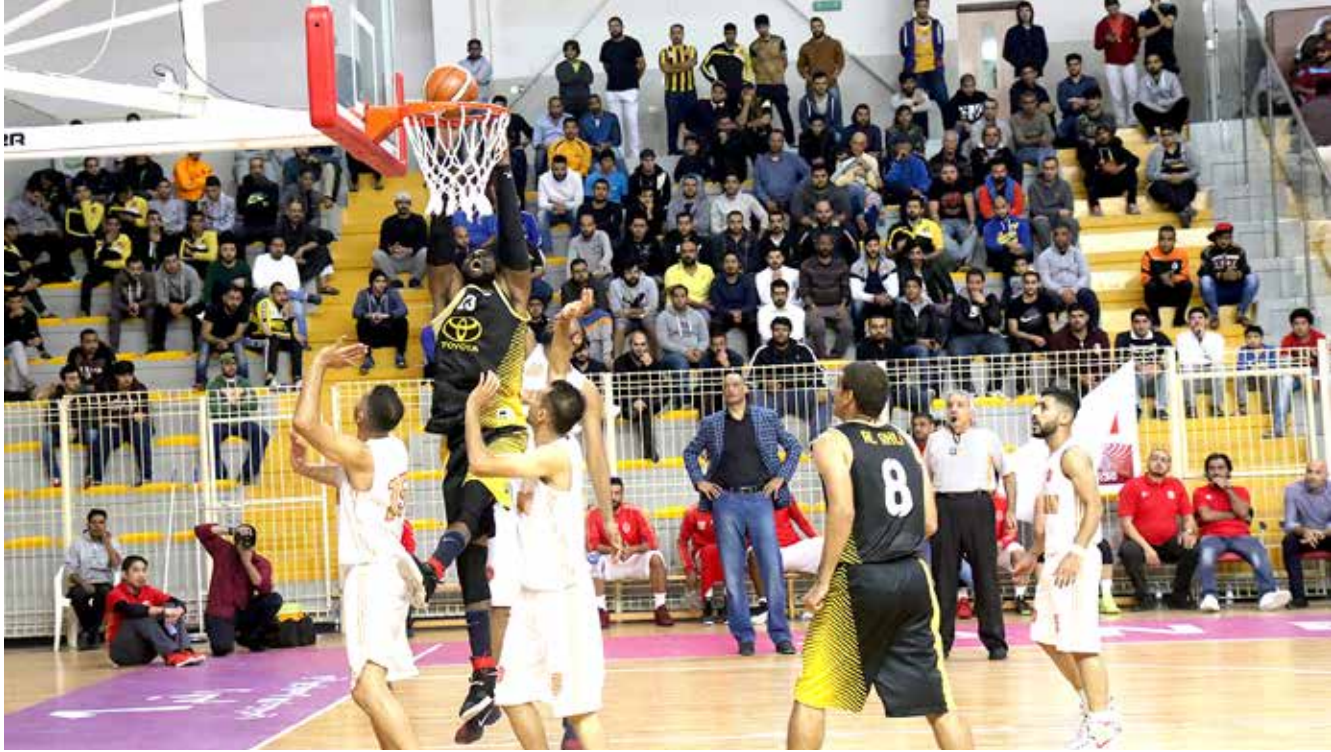
من لقاء سابق بين الأهلي والمحرق

المحرق خاض سلسلة من المباريات الودية ضد الاتحاد ومدينة عيسى وفريق السلام السعودي وفريق النجمة وذلك