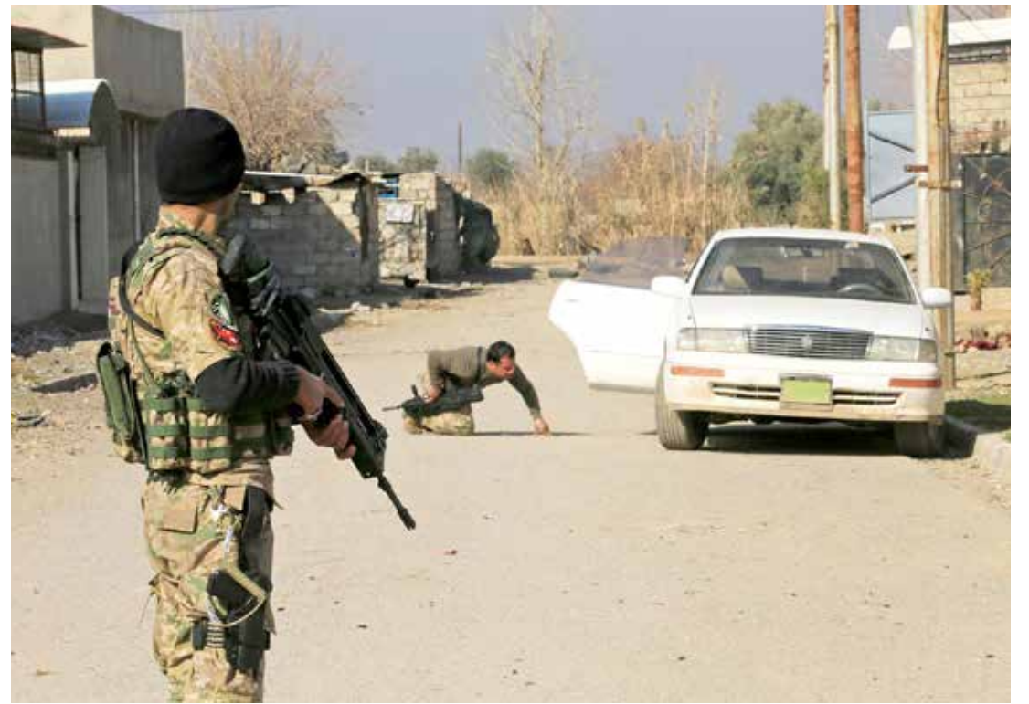
أفراد من قوات الرد السريع العراقية تقتن سيارة خلال معركة مع مقاتلي «داعش» في جنوب الموصل

من جانبه، أكد المبعوث الأميركي على توافق الرؤيتين المصرية والأميركية فيما يتعلق بضرورة مكافحة الإرهاب في ليبيا، نظراً لتبعاته السلبية على المنطقة، كذلك أهمية دفع عجلة التنمية الاقتصادية في ليبيا لتحقيق معدلات نمو مرتفعة تسهم في مواجهة ظاهرتي الإرهاب والهجرة غير الشرعية.