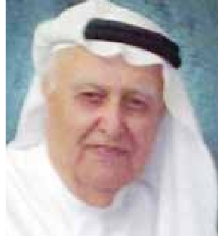
(مصر) وتخرّج فيها العام 1957. التحق بعدها بالعمل في شركة العائلة ومنها امتهن العمل التجاري.