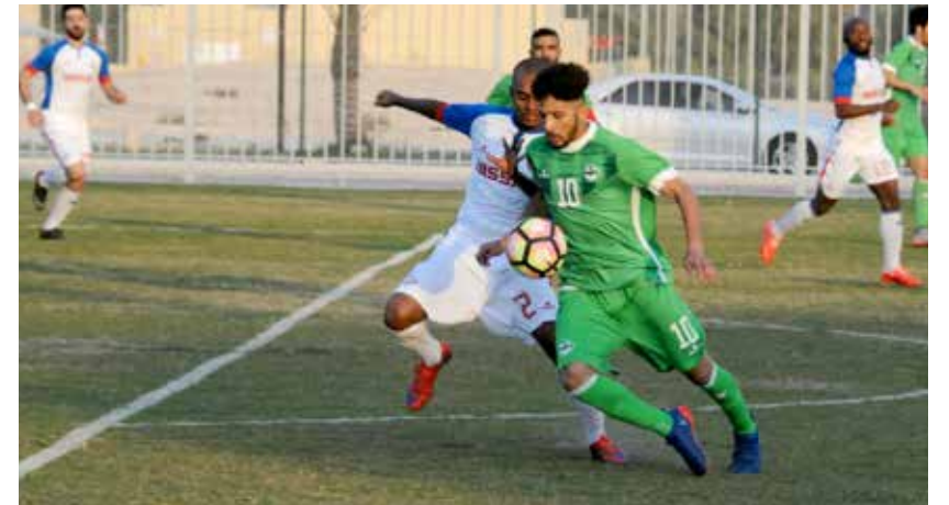
من لقاء البديع ومدينة عيسى