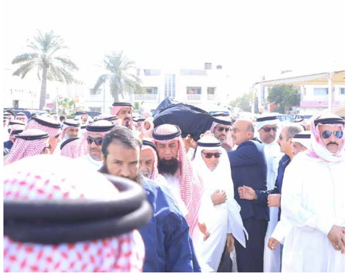
جموع غفيرة شيعت الفقيد إلى مثواه الأخير