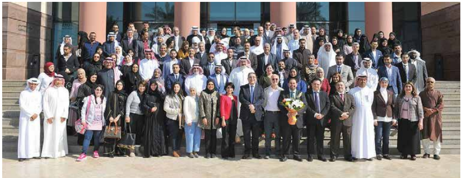
سبكار يعلن عن النسخة الثانية من برنامج «الإعلام الاجتماعي للمدربين»

وقضت لوهان كثيراً من الوقت العام الماضي (2016) في الإمارات العربية المتحدة، وخاصة في دبي، كما سافرت إلى تركيا وتطوّعت للدفاع عن اللاجئين. بالإضافة إلى ظهورها أيضاً في البرنامج التركي التلفزيوني Habertürk للحديث عن ردّ الفعل العنيف الذي واجهته في الولايات المتحدة لاعتناقها الإسلام. وكانت لوهان ظهرت من قبل