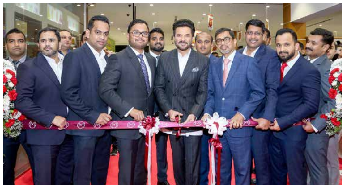
حضر جمهور كبير من محبي نجم بوليوود أنيل كابور في افتتاح المحل رقم 161 عالمياً لـ «مالابار للذهب والألماس» في مجمع لولو هايبر ماركز الحد