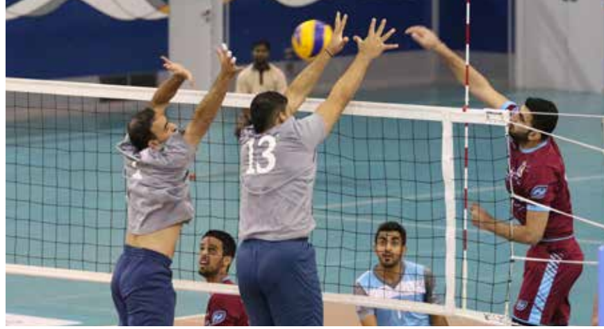
من لقاء الشباب والتضامن

هذا، وتختتم اليوم عند الساعة السادسة مساءً منافسات الجولة الثالثة للدوري وذلك بإقامة لقاء وحيد سيجمع عالي (6 نقاط) والمعامير (بلا نقاط). إذ ستحتضن صالة اتحاد الطائرة بمدينة عيسى الرياضية هذا اللقاء، وفي مباراة ثانية، حقق الشباب فوزه الأول في المسابقة على حساب التضامن، وذلك بثلاثية نظيفة. وجاءت نتائج أشواط اللقاء بواقع: (25-18، 25-15، 25-23).