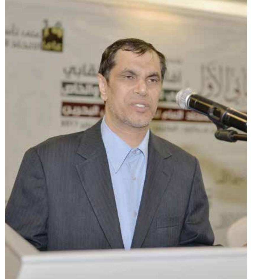
النجار: الاتحاد عريق نظراً إلى نضاله وتمترس القادة النقابيين المخضرمين حوله

لأسف، وقس على ذلك موظفي القطاع الصحي والقطاع الخدمي وما إلى ذلك. وواصل «التحدي الكبير هو كيف نؤسس لهذه الطبقة العمالية الكبيرة نقابات؟ هل نطالب بقانون محلي يسمح لهم بحق التنظيم النقابي؟ القانون يقول لا يجوز لهم التأسيس، ولكن يحق لهم الانضمام إلى النقابات، فهل ننظر إصدار قانون؟ أم نجعلهم ينتسبون إلى النقابات؟ الحل في الفترة الحالية أن نجعلهم ينتسبون إلى النقابات.» هناك دورات من الخارج تأتينا يطلبون لها من قطاع التعليم المعلمين مثلاً و أيضاً دورات في القطاع الخدمي، وهناك الاتحاد الدولي للخدمات، لذا بعد هذا المؤتمر سنسعى بكل جد لتأسيس نقابة عامة لمنتسبي التعليم وسيدخل فيها كأعضاء المدرسون من القطاع الحكومي والخاص، كما نحاول إنشاء نقابة عامة للعاملين في القطاع الصحي العام والخاص، كما سنعمل نقابة عامة للمعلمين في القطاع العام والخاص».