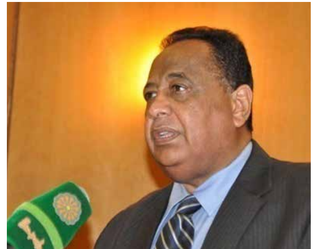
وزير الخارجية السوداني إبراهيم غندور

قال وزير الخارجية السوداني، إبراهيم غندور أمس السبت (14 يناير/ كانون الثاني 2017) إن قرار إدارة الرئيس الأميركي باراك أوباما المبدئي بتخفيف العقوبات عن السودان اتخذ بموافقة تامة من إدارة الرئيس المنتخب دونالد ترامب وبعد اجتماعات سرية استمرت شهوراً. وكانت الولايات المتحدة قد قالت يوم الجمعة إنها سترفع حظراً تجارياً فرض قبل 20 عاماً على السودان لتلغي بذلك تجميداً للأصول وتزيل عقوبات مالية كرد على تعاون الخرطوم في محاربة تنظيم «داعش» وجماعات أخرى.