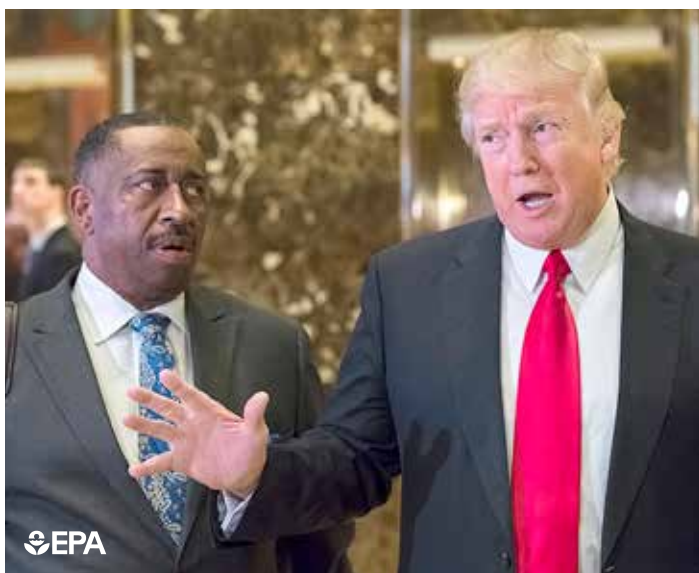
الرئيس الأميركي المنتخب دونالد ترامب خلال حديث مع الصحافة

«5+1» وإيران أكدوا بصوت واحد على تنفيذ هذا الاتفاق متعدد الأطراف والدولي وهم مصررون على تنفيذه الكامل والدقيق. وتابع قائلاً، إنه من الأفضل لشخص لم يتول المسؤولية لغاية الآن أن يفكر جيداً بنتيجة وتداعيات تصريحاته قبل أن يصبح في موقع المسؤولية. كما أكد قاسمي بالقول، «إننا صبورون ومنتظر لنرى من يتولى مسؤولية وزارة الخارجية الأميركية، ومن ثم سنحكم على أدائه وتصريحاته بصورة نهائية».