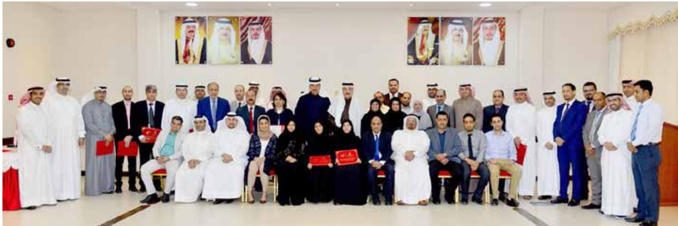
وزير العمل في صورة جماعية مع أعضاء اللجنة العليا المنظمة لحفل تكريم «المجدين»

□ تلقى ولي العهد نائب القائد الأعلى النائب الأول لرئيس مجلس الوزراء صاحب السمو الملكي الأمير سلمان بن حمد آل خليفة برقية شكر جوازية من خادم الحرمين الشريفين عاهل المملكة العربية السعودية الشقيقة الملك سلمان بن عبدالعزيز آل سعود، وذلك رداً