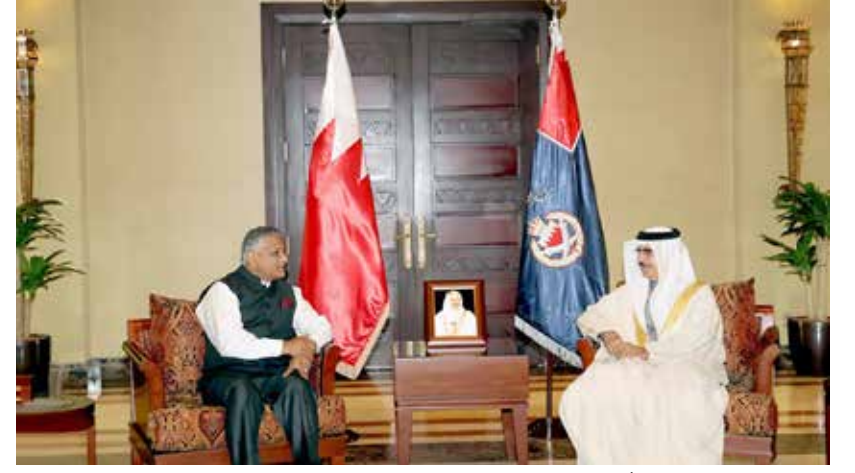
وزير الداخلية مستقبلاً وزير الدولة للشؤون الخارجية الهندي

كما بعث صاحب السمو الملكي ولي العهد نائب القائد الأعلى النائب الأول لرئيس مجلس الوزراء برفيقتي تعزية ومواساة مماثلة إلى كل من ولي العهد نائب رئيس مجلس الوزراء