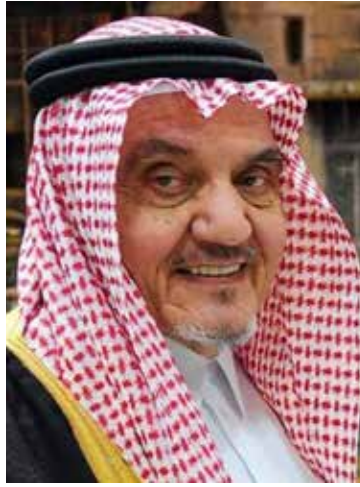
الأمير محمد بن فيصل آل سعود

أمير منطقة مكة المكرمة قبيل أداء صلاة الميت على الأمير محمد بن فيصل بن عبدالعزيز آل سعود