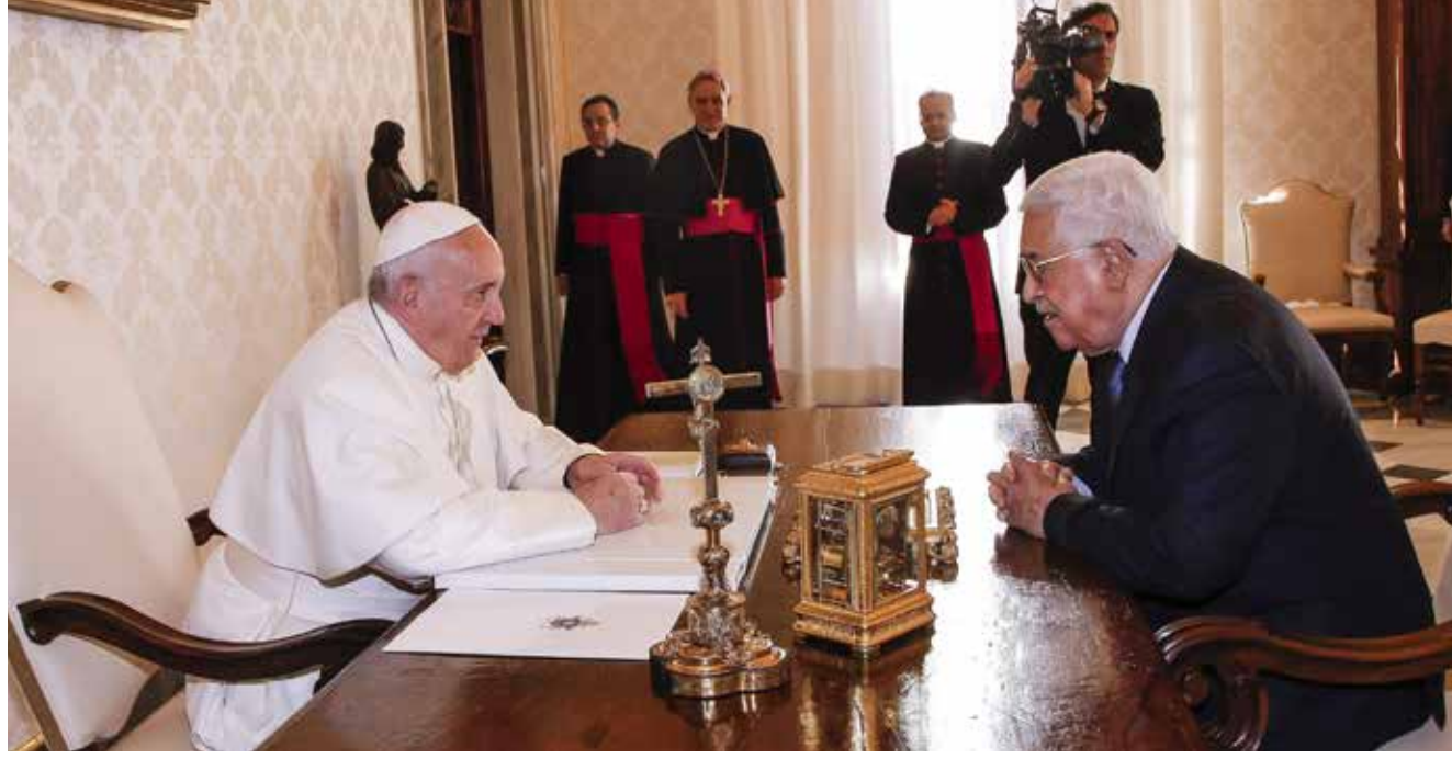
البابا فرنسيس ملتقياً الرئيس الفلسطيني في الفاتيكان

لا يمكن القبول بها وبغية التوصل إلى حل عادل ودائم». وأضاف البيان أن الجانبين عبرا عن تمنياتهما بأن يتم اتخاذ إجراءات بدعم من المجموعة الدولية تساهم في «تعزيز الثقة المتبادلة وفي خلق أجواء تسمح باتخاذ قرارات شجاعة من أجل السلام». على صعيد آخر، وصلت إلى العاصمة الروسية موسكو، أمس (السبت)، وفود تمثل مجموعة من الفصائل الفلسطينية لعقد اجتماعات غير رسمية بهدف التغلب على حالة الانقسام الفلسطيني، وتحقيق المصالحة بين الفصائل الفلسطينية، طبقاً لما ذكرته وكالة «سبوتنيك» الروسية للأنباء أمس. وأفادت الوكالة الروسية بوصول وفود كل من الجبهة الديمقراطية لتحرير فلسطين، والجبهة الشعبية لتحرير فلسطين، والجبهة الشعبية - القيادة العامة، وحزب الشعب، وحركة «الجهاد الإسلامي»، وحركة «فتح». وأشارت الوكالة إلى أنه من المقرر أن يصل في وقت لاحق وفد حركة المقاومة الإسلامية «حماس»، والأمين العام للمبادرة الوطنية الفلسطينية مصطفى البرغوثي. وأفاد مصدر بأحد الوفود، بأنه سيعقد صباح اليوم (الأحد)، أول لقاء بين الفصائل والجهة الداعية.