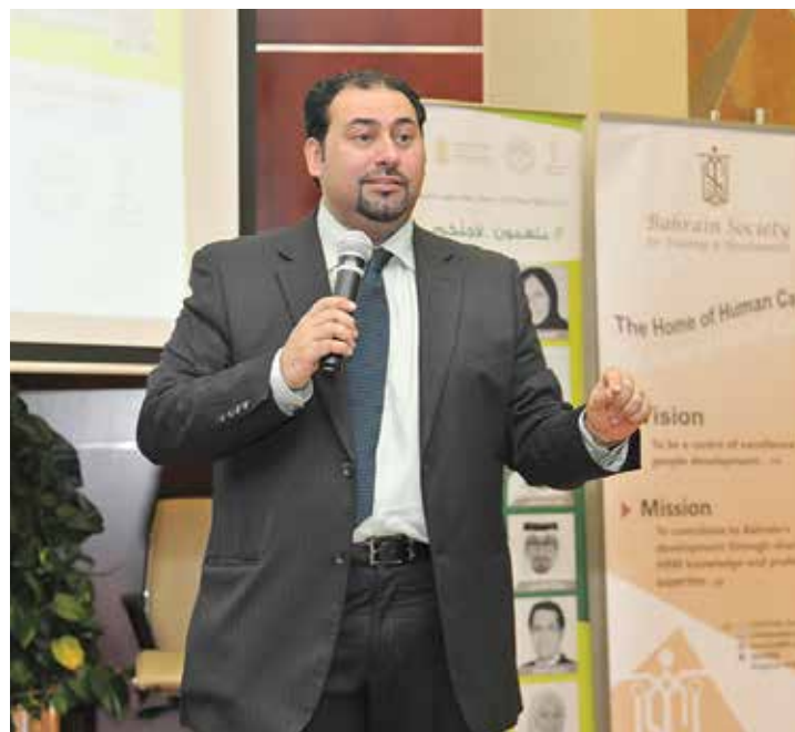
سبكار يطلق النسخة الثانية من برنامج الإعلام الاجتماعي للمدربين