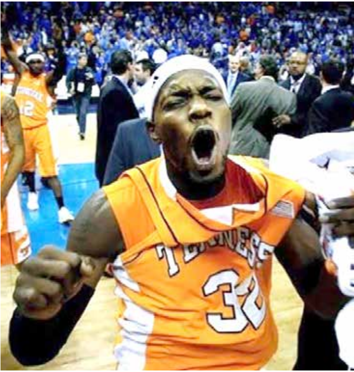
اللاعب الأميركي ويلارد فينستنت