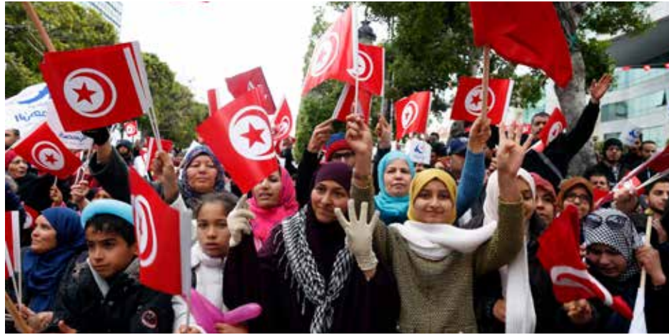
تونسيون يحملون الأعلام الوطنية خلال احتفال بمناسبة الذكرى السنوية السادسة للثورة

بلدة منزل بوزيان التابعة لولاية سيدي بوزيد مردين الشعارين المذكورين. وأفاد أن احتجاجات مماثلة حصلت في المكناسي التي كانت شهدت إضراباً عاماً الخميس للمطالبة بالتنمية والتشغيل. ومساء الجمعة، أقر رئيس الحكومة يوسف الشاهد في تصريح للتلفزيون الرسمي بأن الحكومات المتعاقبة على تونس منذ 2011 فشلت في تحقيق التنمية الاقتصادية التي طالب بها الشعب خلال الثورة. وقال الشاهد «إذا أردنا أن تصبح هذه الديمقراطية صلبة وقوية (...) يجب أن تحقق الأهداف الاقتصادية والاجتماعية للثورة وهي