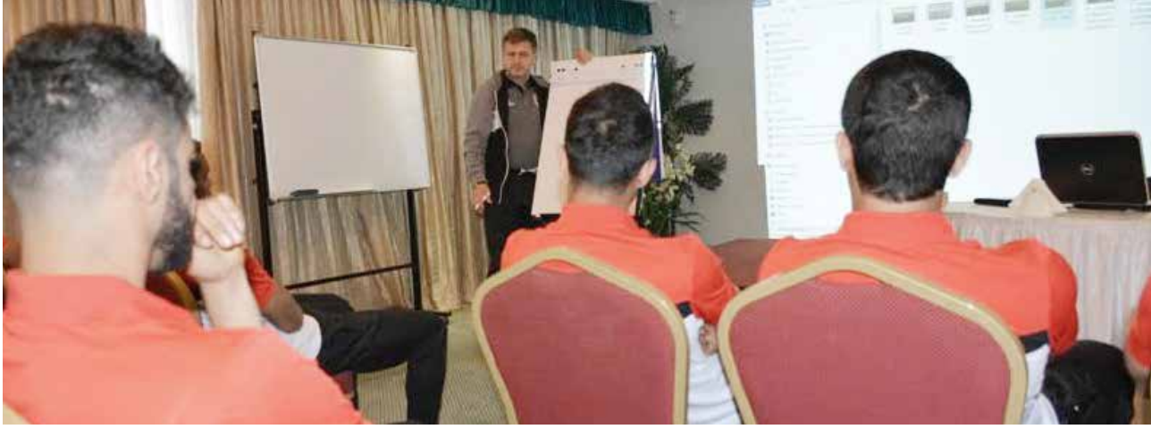
المدرّب سكوب يتحدث مع اللاعبين