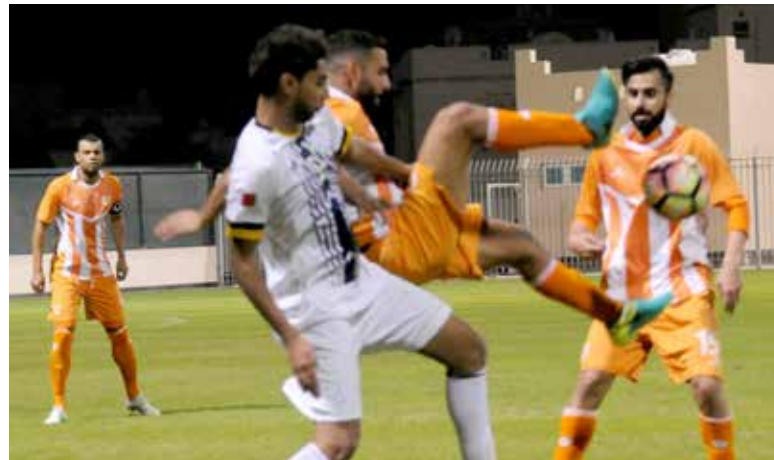
من لقاء الحالة والاتحاد

□ أجرى الاتحاد البحريني لكرة القدم تعديلاً على جدول مباريات الجولة العاشرة «الأولى من القسم الثاني» في دوري فيفا لأندية الدرجة الأولى لكرة القدم، إذ ستقام بالوضع الجديد جميع مباريات الجولة على ملعب مدينة خليفة الرياضية ذلك كالتالي: يوم الثالث من فبراير/ شباط المقبل سيلتقي المالكية مع المحرق الساعة الرابعة وخمس وأربعين دقيقة، تليها في الساعة مباراة الأهلي مع الرفاع الشرقي، وفي اليوم التالي سيلتقي باللقاء الأول البحرين مع النجمة الساعة 4:45 ثم الرفاع مع المنامة الساعة 7، ثم يوم السابع من فبراير/ شباط سيلتقي الحالة مع الحد الساعة السادسة، ولكن هذه المباراة ستؤجل ليوم الثاني عشر من الشهر نفسه بحالة تغلب الحد على الفتح السعودي في تصفيات دوري أبطال آسيا، علماً بأن الحد قبلها سيلتقي أيضاً في التصفيات الأولى من ناساف الأوزبكي.