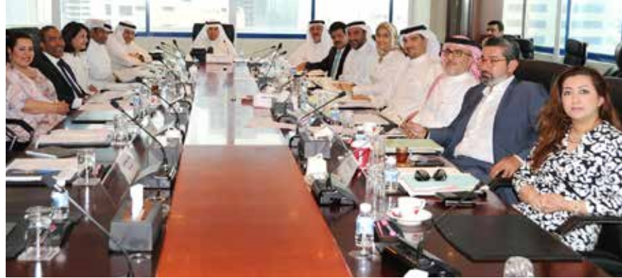
صورة أرشيفية لأحد اجتماعات مجلس إدارة غرفة تجارة وصناعة البحرين

لللمجلس الحالي، لم يتقدم العضو المستقيل بأي خطاب أو ملاحظات أو مقترحات لمجلس الإدارة خلال جميع الاجتماعات التي تمت طوال الثلاث سنوات الماضية والبالغ عددها تسعة عشر اجتماعاً، يطرح من خلالها أي من النقاط التي جاءت في خطاب الاستقالة للنقاش في اجتماعات مجلس الإدارة للوصول إلى حلول واقعية إن وجدت. كما أن العضو المستقيل لم يطلب إدراج أي مقترح على جدول أعمال المجلس طوال المدة الماضية، واكتفى فقط بالمشاركة في حضور تلك الاجتماعات».