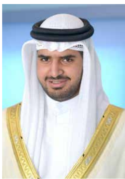
عيسى بن علي

ثمنوا هذه اللفتة من رئيس الاتحاد للأعضاء السابقين