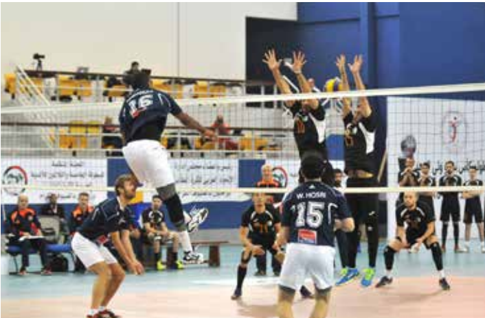
من لقاء تنورين اللبناني والمجمع البترولي الجزائري