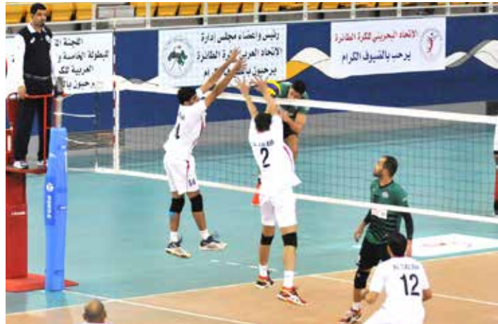
من لقاء السلام العماني والمصراتي الليبي

ليرفع رصيده من النقاط إلى (5)، وجاءت نتائج أشواط اللقاء بواقع: (25-19، 25-17، 25-12).