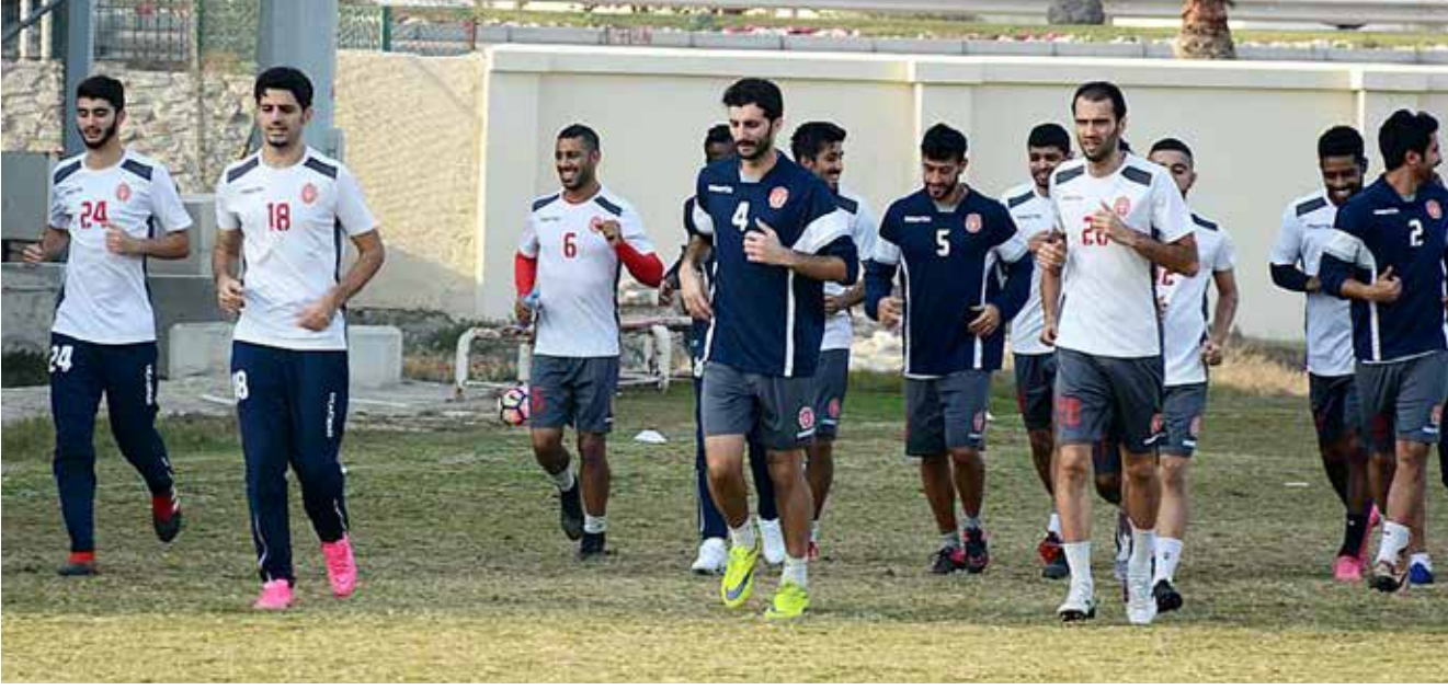
من تدريبات سابقة للمحرق