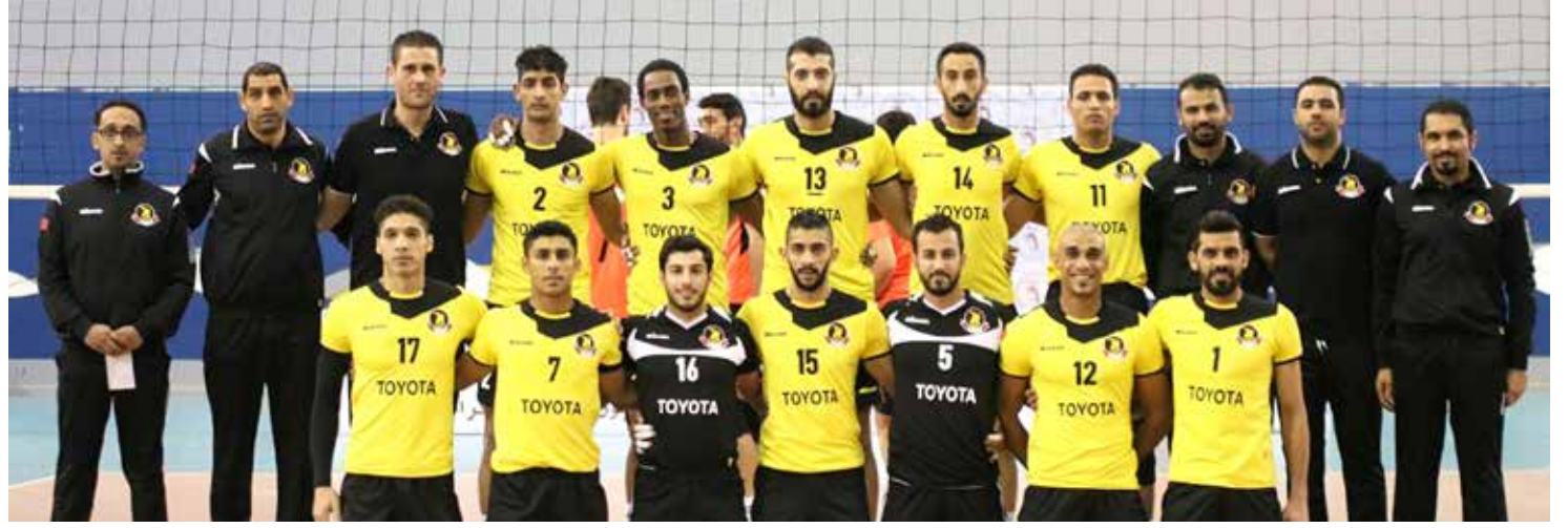
فريق الأهلي لكرة الطائرة

وختم حديثه بالقول: «نحن بأمس الحاجة لفزعت الجماهير الأهلاوية. إذ تواجدهم ومؤازرتهم الفعالة طوال المباراة ستعطي الفريق الحافز لتحقيق النصر بقاء اليوم... إذ نحن نعلم أهمية المباراة وفريقنا قادر على التعامل معها بأفضل طريقة... ونسأل الله التوفيق بالطبع».