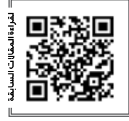
للتواصل عبر وسائل التواصل الاجتماعي

وليس هناك ما يمكن اعتباره أفقاً مجهولاً لمخاطر الطائفية التي عجزت الكثير من الدول والحكومات عن وأدائها، حتى أن الحقيقة المنطقية التي يمكن القبول بها في غمرة كل ذلك التهاون، أن الطائفية والتكفير والعنصرية والتمييز المرتبط بالفساد وغياب العدالة الاجتماعية، لا يمكن أن تنتشر إلا في مجتمعات ودول وحكومات هي في الأساس أسفحت الطريق لها لكي تنمو وتترعرع وتنتشر، وإلا فما من دولة تريد سحق الطائفية والحفاظ على نسجها الوطني وحماية كل المكونات والأديان والمذاهب إلا ونجحت في ذلك.