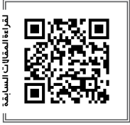
للتواصل عبر وسائل التواصل الاجتماعي

لكن المعضلة الأكبر ليست في السياسة الخارجية فقط، بل في الإدارة الراهنة، فكلما طال أمد وجود ترامب في الحكم سيكون التغيير الأميركي القادم أكبر وأعمق، ففي انتخابات 2018 للكونغرس سنرى حجم التغيير المضاد لسياسات ترامب، لكن في انتخابات 2020 سيقع زلزال كبير في الساحة الأميركية، وهذا بدوره سينعكس على العالم، حينها ستفتح ملفات كثيرة تتعلق بالحقوق والإصلاح والحروب، بواد هذا واضحة الآن في الساحة الأميركية وفي كبرى الصحف والمؤسسات... التغيير القادم في الولايات المتحدة سيكون أكثر ديمقراطية وحقوقية ونقدية تجاه إسرائيل وعنصريتها وأكثر التزاماً بحقوق الإنسان تجاه العالم... إن الولايات المتحدة التي يمثلها ترامب ليست كل الولايات المتحدة، بل يمثل ترامب الرئيس الآن قريباً صغيراً سيزداد تراجعاً مع الوقت... ترامب ليس زعيماً من العالم الثالث يحكم بلا مساءلة وخارج فضاء الشعب والمؤسسات، إنه بالكاد يمسك بخيوط البيت الأبيض نفسه.