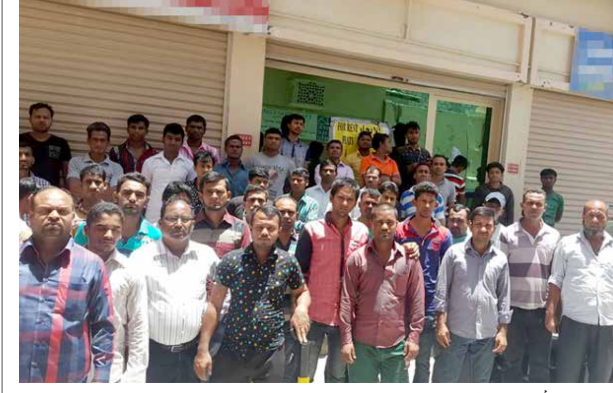
العمال تجمّعوا أمام مكتب صاحب العمل البحريني (التفاصيل ص 7)