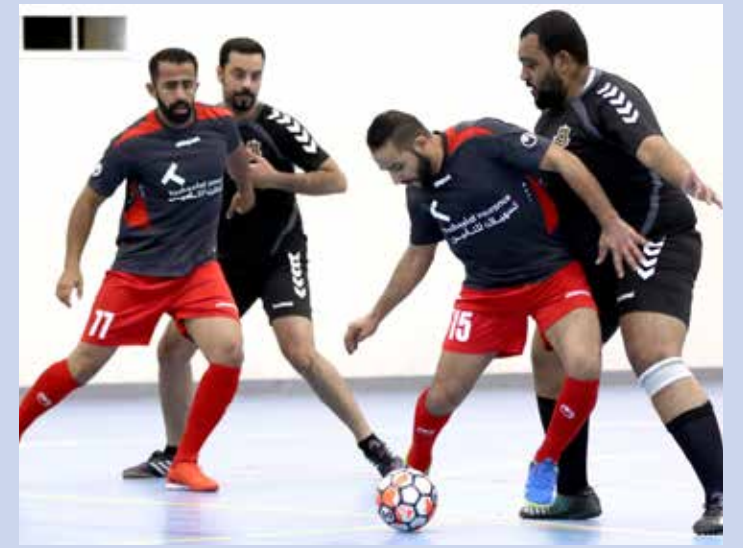
من منافسات «تأمين 9»