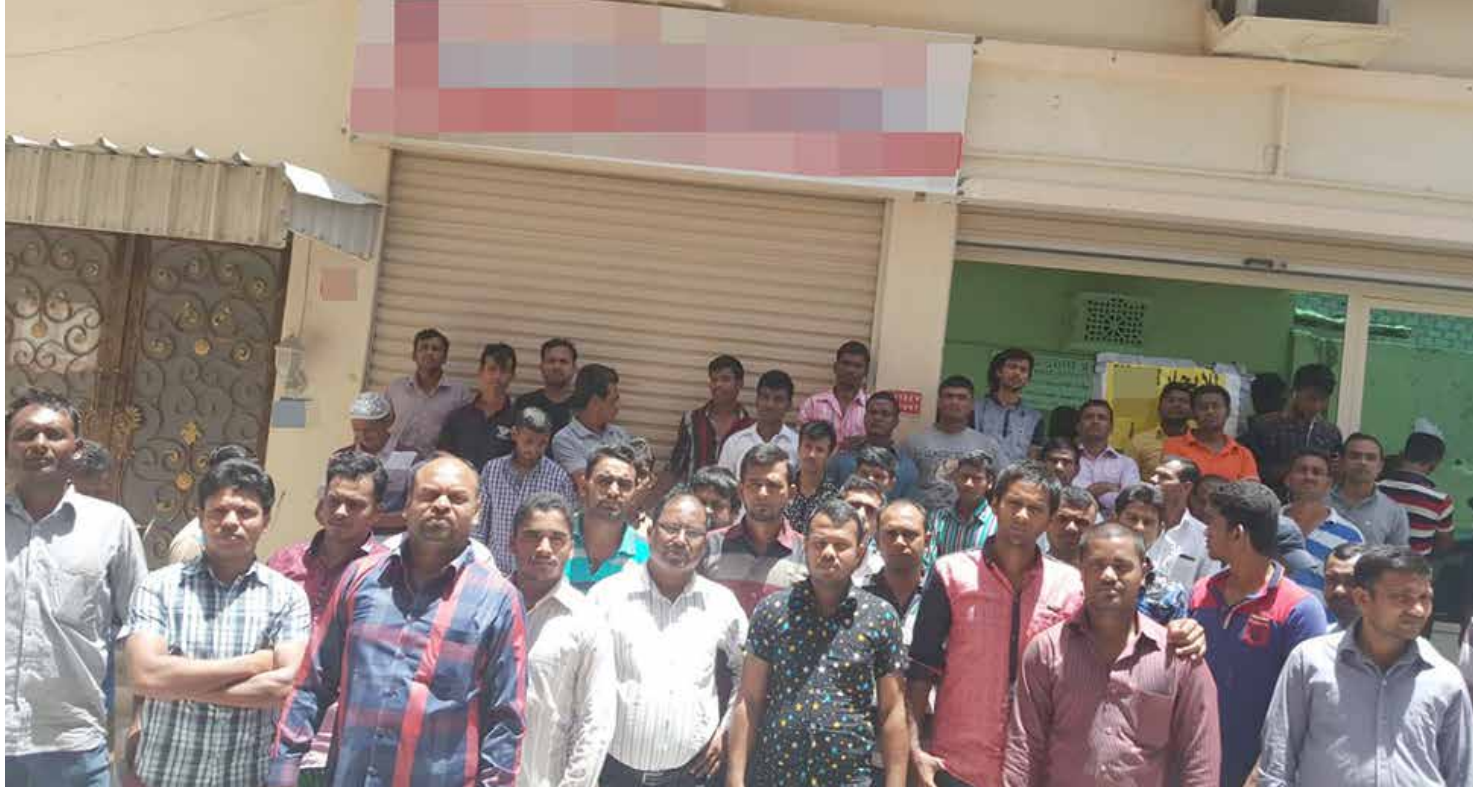
العمال تجمعوا أمام مكتب صاحب العمل البحريني