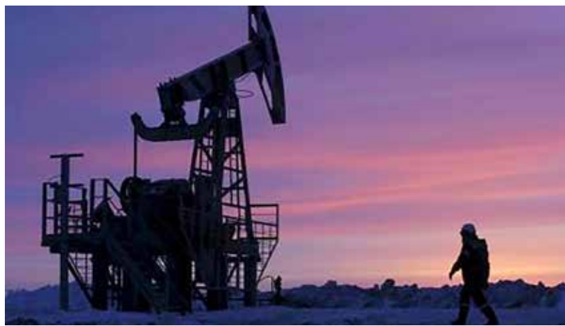
حقل النفط في روسيا

وبالمن، ارتفع إنتاج النفط إلى 46.298 مليون مقابل 45.002 مليون في أبريل كون شهر مايو يزيد يوما واحدا عن شهر