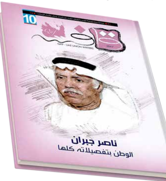
غلاف العدد العاشر من «قاف»