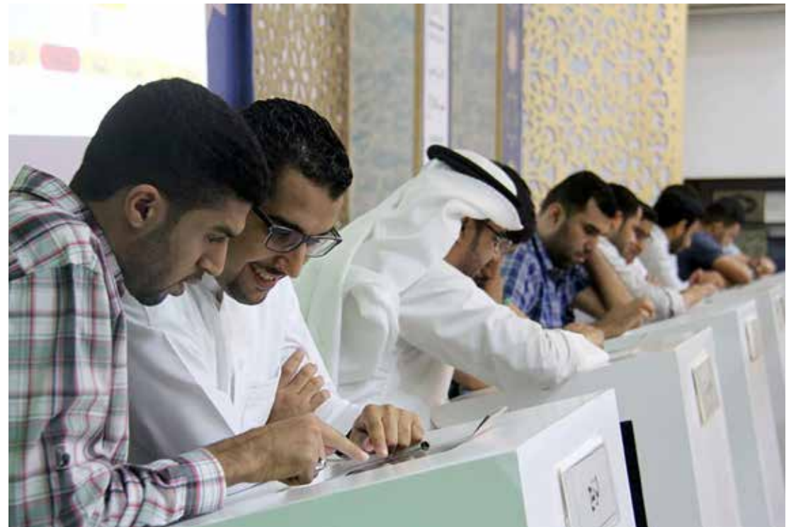
منافسات مسابقة الشيخ الجمري الرمضانية