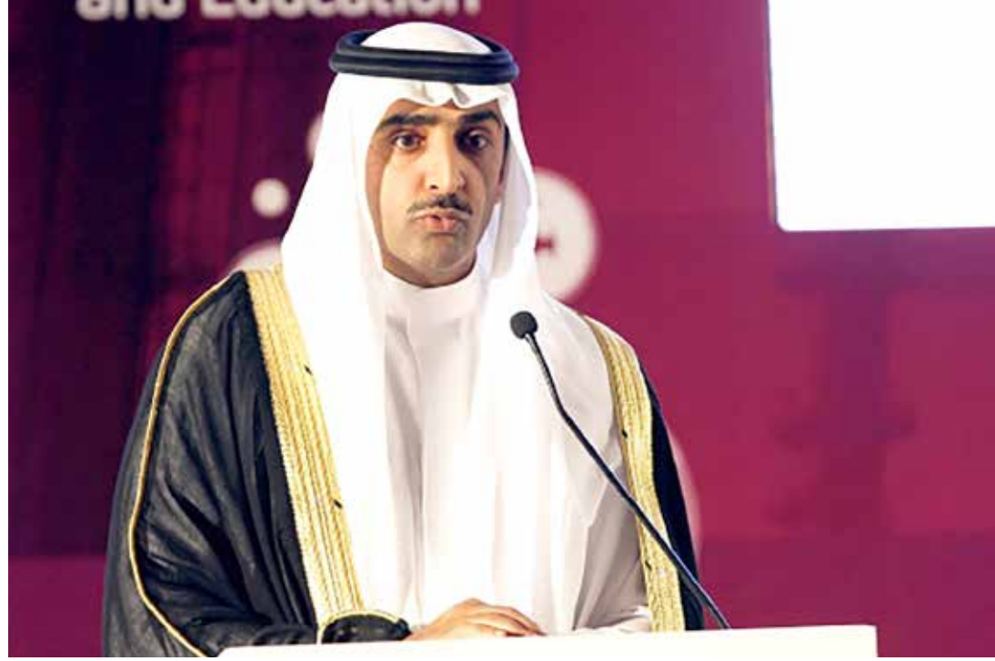
وزير النفط الشيخ محمد بن خليفة آل خليفة

وتابع «أما بالنسبة لكلفة البرميل من حقل ابوسعفة والذي يخضع لإدارة شركة أرامكو السعودية، فنود الإفادة بان حصة البحرين تبلغ 50 في المئة من إنتاج الحقل، ويتم احتساب كلفة برميل الخام عن طريق رسوم خاصة بالإنتاج تدفعها شركة بابكو لشركة أرامكو».