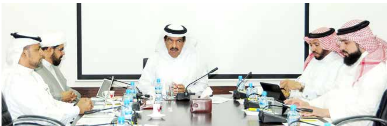
«مالية النواب» رفضت المقترح والقرار بيد الأعضاء يوم الثلاثاء المقبل

الاقتصاد البحريني، لأن تطبيق الاقتراح بقانون سيؤدي لعزوف الشركات الأجنبية والخليجية عن الاستثمار بالمملكة».