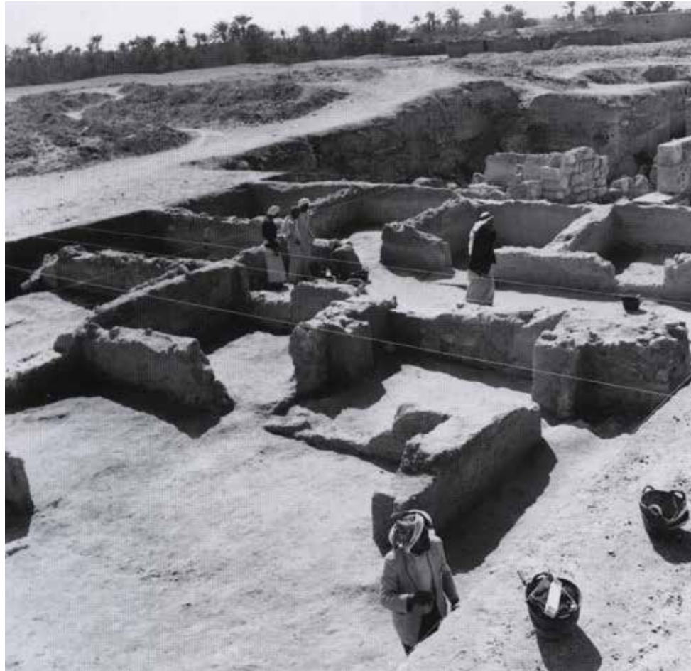
آثار المدينة/ القرية الإسلامية في موقع قلعة البحرين (Hojlund & Andersen 1994)

من خلال نتائج كلا البعثتين الدنماركية (Frifelt 2001, pp. 35 – 36, pp. 45 – 61)، والفرنسية