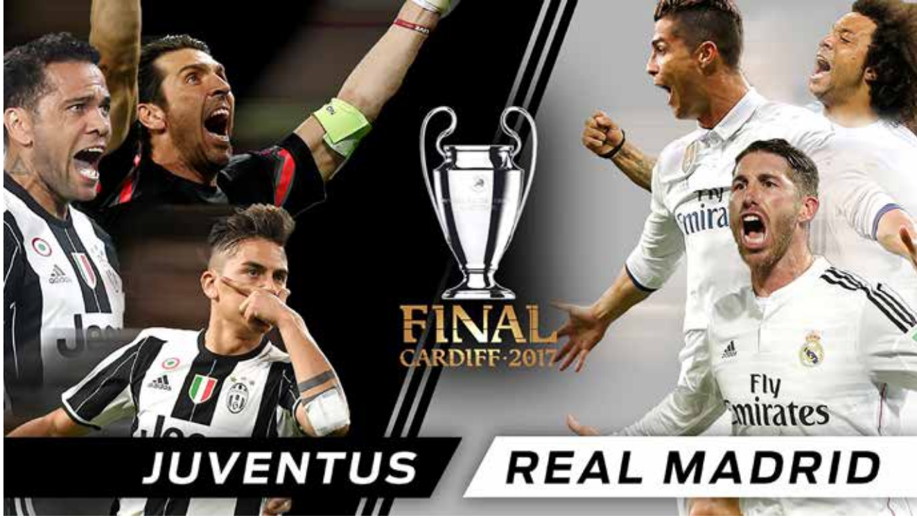
هل ينجح ريال مدريد في تحقيق اللقب الثاني على التوالي أم يوفق يوفنتوس في «كسر العقدة» للمرة الثالثة؟

ولا يعاني الفريقان من إصابات مؤثرة، ولكن لم يتضح بعد ما إذا كان زيدان الذي قضى جزءاً من مسيرته الكروية في يوفنتوس، سيدفع بغاريث بيل العائد من الإصابة، أم المتألق ايسكو، في مركز الجناح. وتحظى المباراة النهائية بإجراءات أمنية غير مسبوقه في كارديف، إذ تم نشر قرابة 6 آلاف جندي وضابط في جميع أنحاء الملعب الذي يتسع لـ66 ألف مشجع، وكذلك في شتى أنحاء المدينة، وسيجري غلق سقف الملعب للمرة الأولى في نهائي دوري الأبطال.