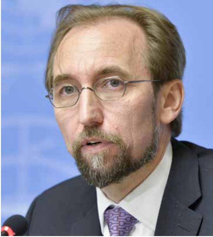
زيد رعد الحسين

المحاكمة وفق الأسس القانونية. وقد عبّر المفوض السامي عن قلقه حيال العنف وعمليّات التوقيف لأنها برزت وكأنّها جزء من حملة أوسع نطاقاً ضدّ المعارضة في البلاد. فنهار الأربعاء، خلّت محكمة في المنامة أحد الجمعيات السياسية المعارضة التي لا تزال قائمة في البلاد، وهي جمعية العمل الوطني الديمقراطي، والمعروفة باسم «وعد». وتشير المصادر المطلعة إلى استدعاء عدد من الناشطين والمدافعين عن حقوق الإنسان للاستجواب مؤخرًا، ووصلتنا ادّعاءات تشير إلى سوء معاملتهم خلال الاستجواب. وفي شهر أبريل/ نيسان من هذا العام، منح تعديل دستوري المحاكم العسكرية حق محاكمة المدنيين. وختم المفوض السامي قائلاً: «تشير التقارير إلى أنّ المدافعين عن حقوق الإنسان العاملين في البحرين لا يزالون يواجهون القيود والترهيب والاستجواب والاحتجاز ومنع السفر. وأحد البحرين على اختيار مسار آخر - هو مسار التواصل والحوار، وعلى مساهلة مرتكبي العنف بغض النظر عن هويّتهم. وأكد على استعداد مكتبه لتقديم المساعدة أو المشورة التقنيّة بشأن تعزيز وحماية حقوق الإنسان في البحرين».