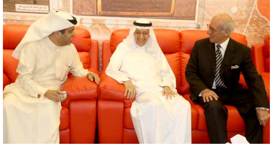
وزير شؤون مجلس الوزراء محمد المطوع خلال زيارته لمجلس «الوسط» الرمضاني

سنتان لتجاوز تأثيرات هبوط النفط... وتحقيق التوازن