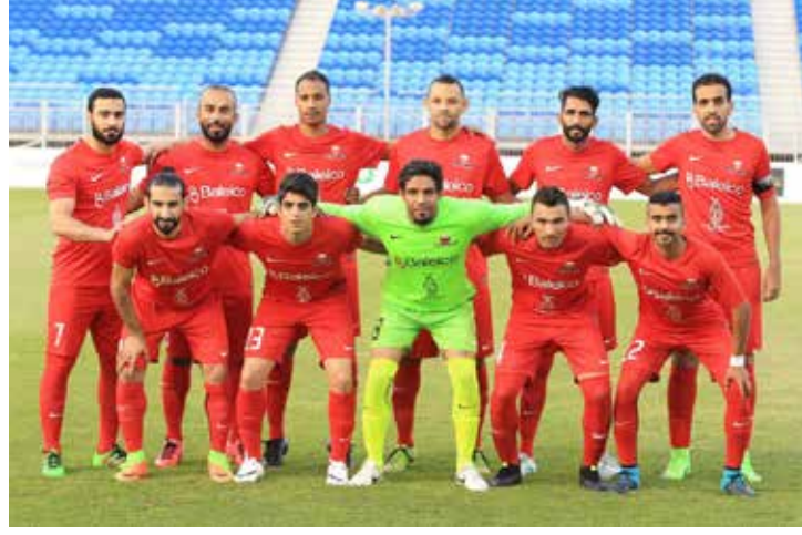
جنرز يوناييتد وصيف حامل اللقب في مباراة صعبة

دورة سمو الشيخ ناصر بن حمد آل خليفة الرضائية الثالثة للألعاب الرياضية "ناصر 10" من ٢١ مايو ولغاية ٩ يونيو ٢٠١٧