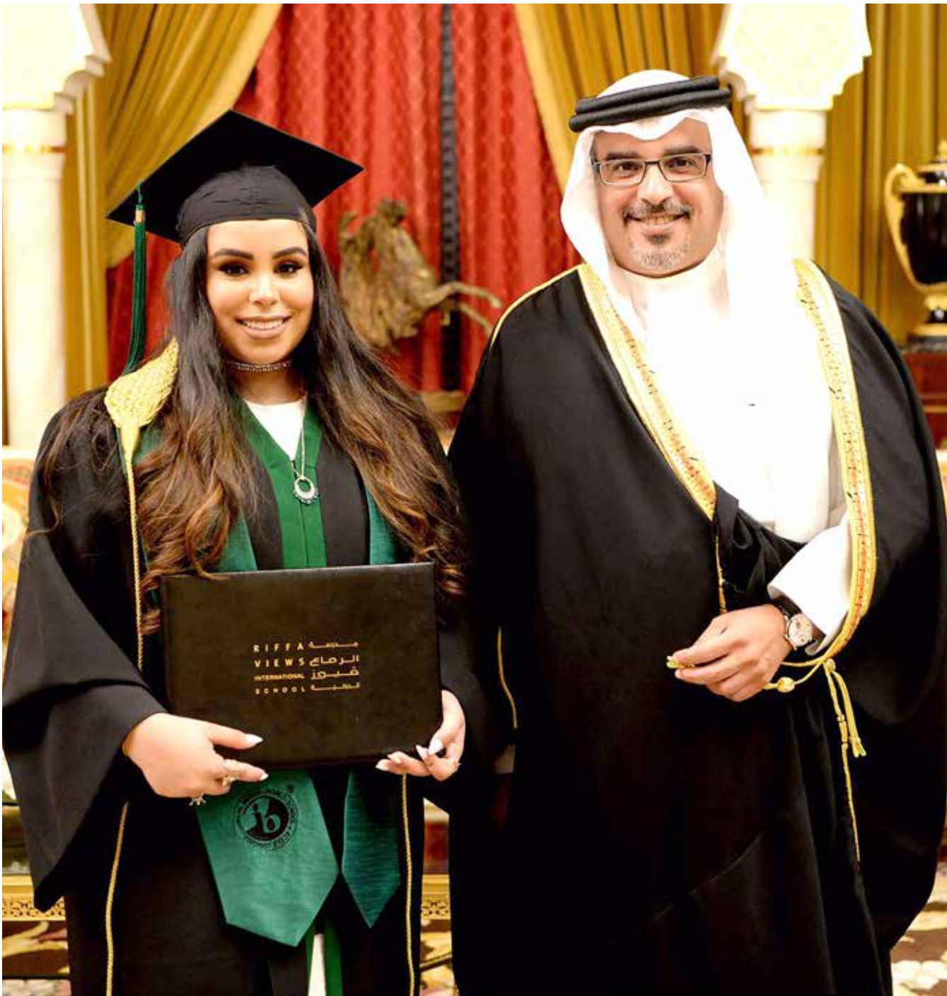
سمو ولي العهد يحضر حفل تخرج كريمته سمو الشيخة فاطمة الدانة من مدرسة الرفاع فيوز الدولية

■ المنامة - بنا □ حضر ولي العهد نائب القائد الأعلى النائب الأول لرئيس مجلس الوزراء صاحب السمو الملكي الأمير سلمان بن حمد آل خليفة، وقرينة عاهل البلاد صاحبة السمو الملكي الأميرة سبيكة بنت إبراهيم آل خليفة، حفل تخرج كريمته سمو الشيخة فاطمة الدانة بنت سلمان بن حمد آل خليفة من مدرسة الرفاع فيوز الدولية خلال الحفل الذي أقامته المدرسة مساء أمس (الجمعة)، في فندق الريفز كارلتون لتخريج دفعة 2017 التي ضمت 23 خريجاً. كما حضر الحفل عدد من كبار أفراد العائلة المالكة الكريمة وعدد من كبار المسؤولين. وقد هنأ صاحب السمو الملكي ولي العهد نائب القائد الأعلى النائب الأول لرئيس مجلس الوزراء كريمته سمو