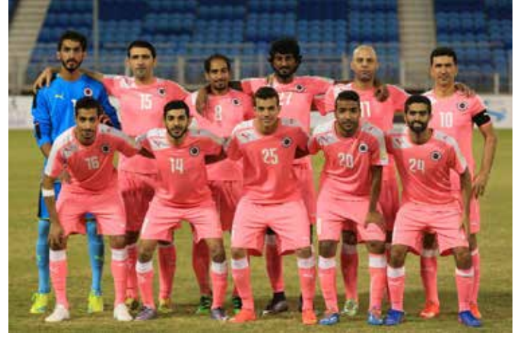
فيكتوريوس يريد مواصلة طريق الحفاظ على البطولة