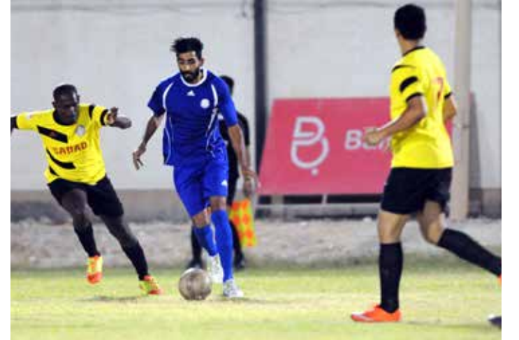
من لقاء دمستان وصدد

ويختتم الجنرال قائلاً «أتمنى ألا نستمر في بحر الاجتهاد وعدم وضوح معالم التخطيط، الاتحادات الدولية والاتحادات في مختلف الدول لديها جداول مدروسة علمياً ومعروفة للجميع من مدربين ولاعبين وإداريين وجماهير، التخطيط السبيل نحو الارتقاء بالمستوي الفني، لا توجد بدائل للتخطيط فإما أننا نخطط أو نتخبط».