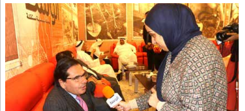
السفير الفرنسي في البحرين مصطحباً لـ «الوسط»

أكد السفير الفرنسي في البحرين برنارد رينو فابر أن رمضان فرصة للتعرف على الناس والانخراط في المجتمع وذلك من خلال المشاركة في المجالس الرمضانية التي تقام خلال الشهر. وقال فابر في حديث لـ «الوسط»: «إن الأجواء الرمضانية ليست بالغريبة عني، فلقد كنت سفيراً في مصر قبل أن أكون في البحرين، قد يكون هناك فرق في الأجواء الرمضانية بين مصر والبحرين، إلا أن رمضان فرصة بالنسبة للجميع للتعرف على الناس والانخراط في المجتمع».