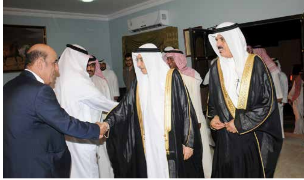
نائب رئيس مجلس الوزراء في مجلس الوزير النعيمي