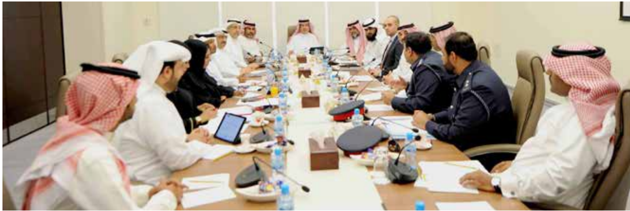
«خارجية النواب»: لا يجوز تسجيل المولود باسم مخالف للنظام العام

ومن جهتها، عدلت لجنة الشؤون الخارجية والدفاع والأمن الوطني المختصة بالنظر في المشروع بقانون تعديلاً، جاء فيه «وفي جميع الأحوال لا يجوز تسجيل المولود باسم مخالف للنظام العام، أو أن يشترك أخوان أو أختان من الأب في اسم واحد، على أن تحدد اللائحة التنفيذية الأسماء المخالفة للنظام العام».