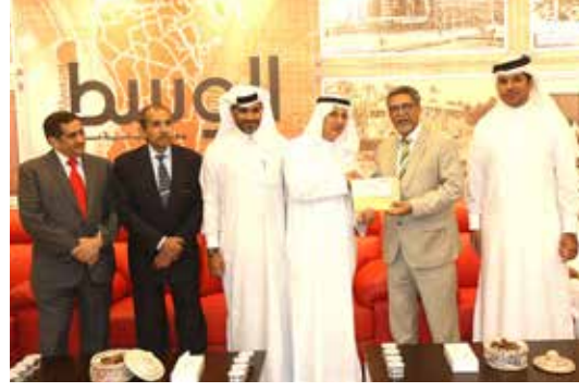
تسليم مجموعة من الجمعيات الخيرية البحرينية ريع معرض الكتب المستخدمة