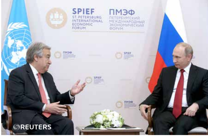
بوتين خلال اجتماعه مع غوتيريس خلال المنتدى الاقتصادي الدولي في سانت بطرسبرغ أمس

كما جدد الرئيس الروسي انتقاد السياسة التي اعتمدها الولايات المتحدة في السنوات الأخيرة في سورية وأوكرانيا، لكنه رفض «الحكم» على قرار ترامب بالانسحاب من اتفاق باريس بشأن المناخ داعياً إلى «عمل مشترك» معه في القضايا المناخية.