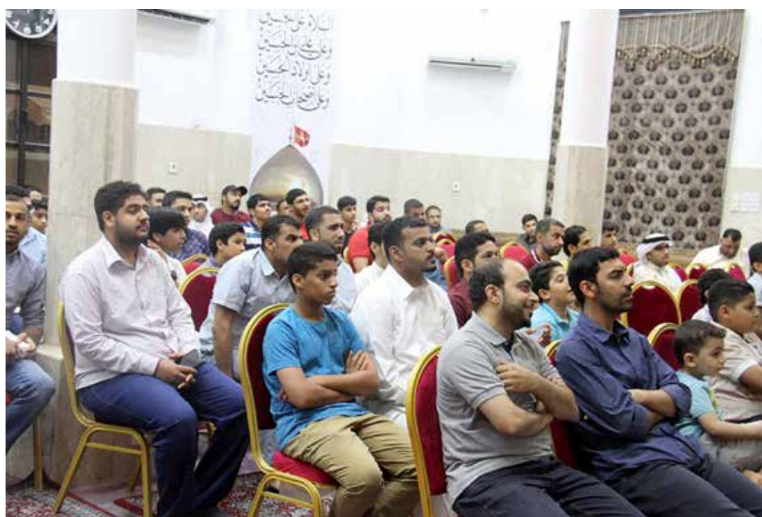
الحضور يتابعون التنافس في المسابقة