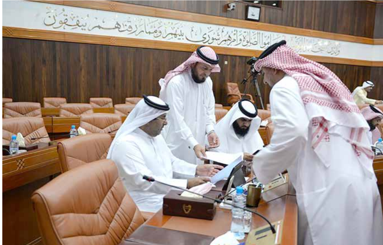
نواب: نريد تقييد الحكومة في عملية فرض الرسوم أو زيادتها

وقد توافقت اللجنة المالية مع مقدمي الاقتراح بقانون على تعديل صيغته، بحيث ينص على أن تضع القوانين حدود قصوى للرسوم التي يكون للوزير المختص تحديد فئاتها ونسب زيادتها أو تخفيضها، ويحظر تجاوز هذه الحدود القصوى. كما لا يجوز زيادة الرسوم السارية حتى يتم وضع هذه الحدود القصوى على الرسوم في القوانين المنظمة. وكان رأي لجنة الشؤون التشريعية