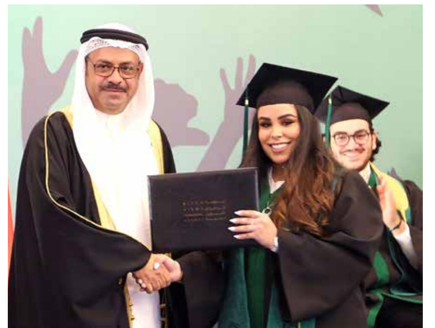
سمو الشيخة فاطمة الدانة خلال حفل تخرجها

■ المنامة - بنا □ حضر ولي العهد نائب القائد الأعلى النائب الأول لرئيس مجلس الوزراء صاحب السمو الملكي الأمير سلمان بن حمد آل خليفة، وقرينة عاهل البلاد صاحبة السمو الملكي الأميرة سبيكة بنت إبراهيم آل خليفة، حفل تخرج كريمته سمو الشيخة فاطمة الدانة بنت سلمان بن حمد آل خليفة من مدرسة الرفاع فيوز الدولية خلال الحفل الذي أقامته المدرسة مساء أمس (الجمعة)، في فندق الريفز كارلتون لتخريج دفعة 2017 التي ضمت 23 خريجاً. كما حضر الحفل عدد من كبار أفراد العائلة المالكة الكريمة وعدد من كبار المسؤولين. وقد هنأ صاحب السمو الملكي ولي العهد نائب القائد الأعلى النائب الأول لرئيس مجلس الوزراء كريمته سمو