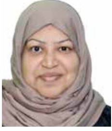
رملة عبدالحميد كاتبة بحرينية