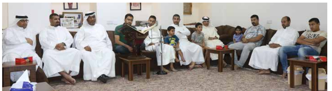
مجلس عائلة بيت الملاح