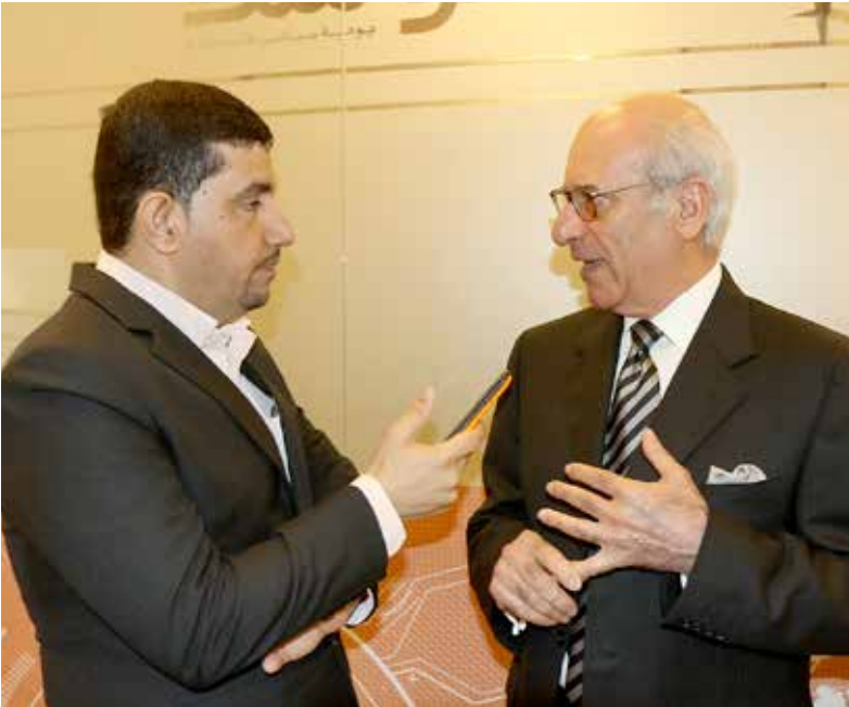
وزير شؤون مجلس الوزراء محمد المطوع مصحراً لـ «الوسط» عقيل الفردان

«التفاصيل لم نصل إلى شيء بشأنها إنما أتحدث عن مجمل الأشياء، وعلى المواطنين أن يتأكدوا أن الحكومة تعمل في هذا الاتجاه، تطمين المواطن في الوقت الحالي وتطمين الأجيال القادمة لكي لا تلوم الجيل الحالي على تكبيلها بديون حالية»، معبراً عن اطمئنانه حيال ذلك، وأضاف «سوف نعمل تماماً ونحن مطمئنون إلى ذلك من أن خدمات المواطنين ومكتسباتهم ستكون مضمونة وأن مستقبل الأجيال سيكون محفوظاً إن شاء الله». وفيما يتعلق بعنوان ترشيد الإنفاق وملاحمه، تحدث الوزير «بشأن الترشيد في المصروفات الحكومية هناك لجنة برئاسة نائب رئيس مجلس الوزراء سمو الشيخ محمد بن مبارك آل خليفة، وهي تعمل على إعادة هيكلة الحكومة بما يجعل من فاعليتها أكبر، وترشيد الإنفاق فيها أفضل»، مجدداً الحديث عن تفاؤله وهو يختتم حديثه «شخصياً لست قلقاً بل متفائلاً».