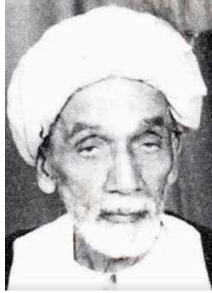
الشيخ محمد علي التاجر