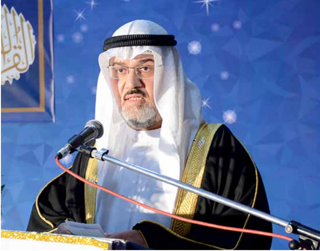
الشيخ فريد المفتاح