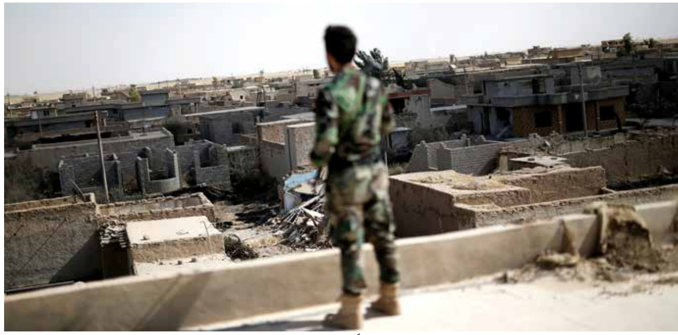
عنصر من الحشد الشعبي يقف فوق مبنى مدرسة تم تحريرها مؤخراً من «داعش»

وشهد حي الكرادة في بغداد وقضاء هيت في الأنبار الأسبوع الماضي انفجارين دمريين أوقعا عشرات القتلى والجرحى.