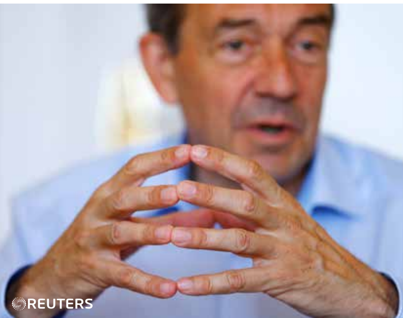
رئيس الصليب الأحمر بيتر ماورر خلال مؤتمر صحفي بشأن سورية في جنيف أمس

أقصى إلى حلب ومناطق أخرى. وذكر أن ما بين 700 ألف و800 ألف آخرين ربما يفكرون في العودة إلى منازلهم في تلك المناطق أو بموجب اتفاقات محلية لوقف إطلاق النار تتضمن إجلاء مقاتلي المعارضة إلى محافظة إدلب. وأضاف أن الصليب الأحمر والهلال الأحمر السوري يمكنهما إصلاح البنية التحتية المتضررة بشدة بحيث يتسنى تبادل الأسرى في أي وقت قريب.