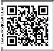
للتعليق على المقال

وبالتالي، في تقديري، الأمر بحاجة لمراجعة موضوعية شجاعة من قبل القيادات الروحية والدينية العربية المعنية المعارضة، وبخاصة غير الميدانية منها لتلافي مستقبلاً وقوع مثل تلك الحالات المؤسفة من إراقة الدماء، وزهق الأرواح في ظل أوضاع متروية من اختلال الموازين والتي يتم فيها فرض تكبير أيدي حركة المعارضة تكبيلاً شبه كلي، وفرض الشلل شبه التام لحركة الجماهير.