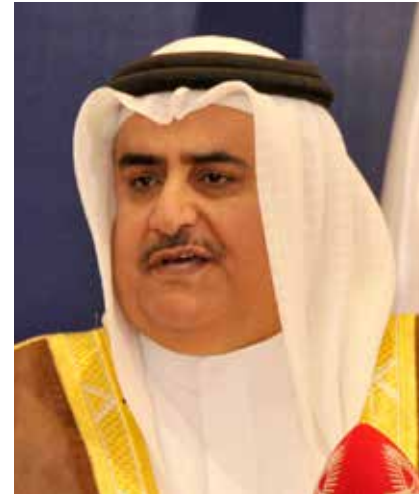
الشيخ خالد بن أحمد آل خليفة

وقال: «قام فريق فني من مكتب المفوضية السامية لحقوق الإنسان بزيارة لمدة شهرين إلى مملكة البحرين في أوائل 2014 وقد كان الغرض من هذه الزيارة هو عقد مشاورات مع جهات حكومية ورسمية ومنظمات المجتمع المدني ووضع برنامج التعاون الفني وبناء القدرات، وعلى ضوء هذه المشاورات توصل الجانبان إلى مشروع