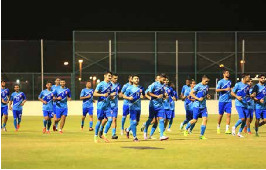
من تدريبات الأحمر استعداداً للمرحلة القادمة