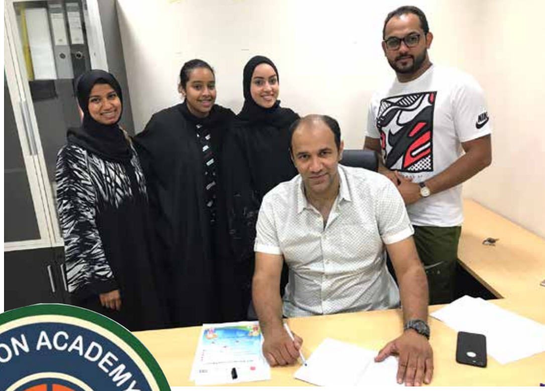
فريق عمل الأكاديمية