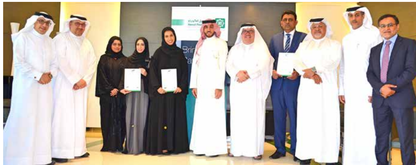
صورة جماعية لـ«فرسان بيتك» الجدد مع فريق الإدارة

قام بيت التمويل الكويتي - البحرين بتكريم ثلاثة موظفين متميزين في البنك ضمن برنامج «فرسان بيتك» وذلك بعد أن قدموا إنجازات ملحوظة خلال الربع الأول من العام 2017، وتم اختيار هؤلاء الموظفين بناءً على أدائهم وإنجازاتهم الاستثنائية في العمل، حيث حصل كل موظف على مكافأة نقدية بالإضافة إلى شهادة تقديرية من إدارة البنك.