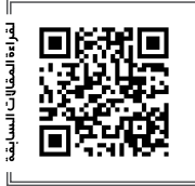
للمزيد من المقالات السابغة

خيوط قضية الفساد يمكن فكها من خلال عدد من الأسئلة هي: كيف يجبر مستثمر بحريني على إخلاء المنتزه على رغم تقيده بدفع الإجراءات أولاً بأول وعلى رغم نجاحه في تطوير المنتزه بصورة جميلة؟ ومن هو المستفيد من ممارسة كافة الأساليب غير القانونية لإجباره على ترك المنتزه؟ ولماذا صبر المسؤولون على المستثمر الحالي لمدة 13 عاماً دون أن يحركوا ساكناً، ولم يمهّلوا المستثمر البحريني ولو لمدة أسبوع واحد لكي يقوم بتفكيك الألعاب بطريقة صحيحة بدلاً من إتلافها نهائياً؟