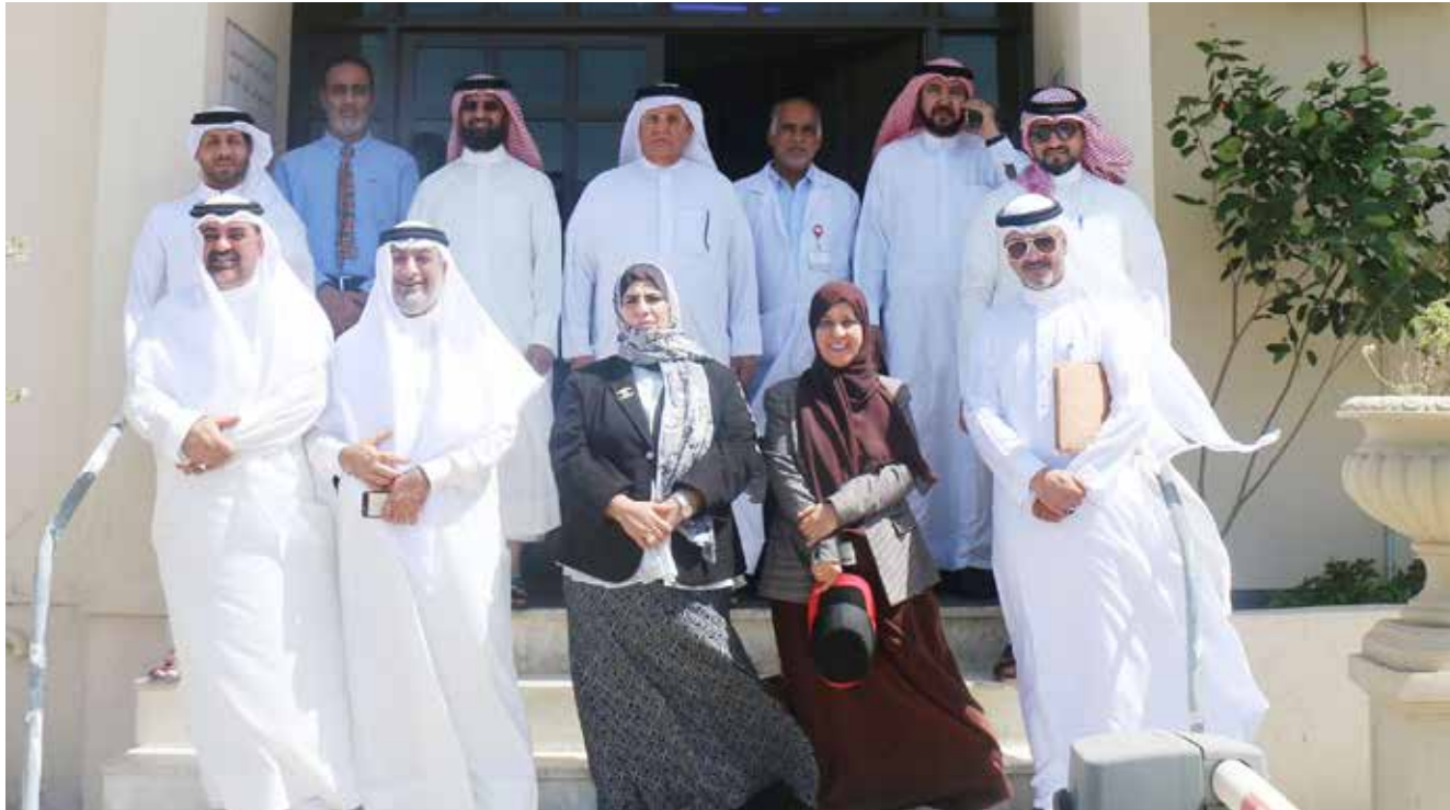
زيارة لجنة التحقيق الطبية إلى مخازن الأدوية بوزارة الصحة

كما تتضمن المحاور أيضاً تقييم الخدمات الطبية المقدمة للمراجعين والمرضى، والتحقيق في اختفاء وإلغاء عدد من الأدوية الرئيسية المخصصة لعلاج الأمراض المزمنة، والتحقيق في الاستقلالات الجماعية وحالات التقاعد للكادر الطبي البحريني في المستشفيات والمراكز الطبية الحكومية.