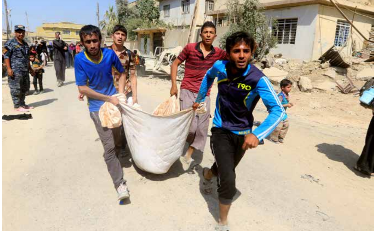
عراقيون نازحون يحملون صبياً جريحاً من اشتباكات في غرب الموصل

من جانب آخر ذكرت مصادر عسكرية أن قوات الشرطة الاتحادية والرد السريع تواجه «مقاومة شرسة من (داعش) تعيق تقدم قوات الرد السريع والشرطة الاتحادية لإكمال تحرير حي الزنجيلي بسبب اكتظاظ المنطقة بالسكان الذين يقعون داخل منازلهم، حيث يتحصن التنظيم بالأهالي في الساحل الأيمن من الموصل فضلاً عن عدم