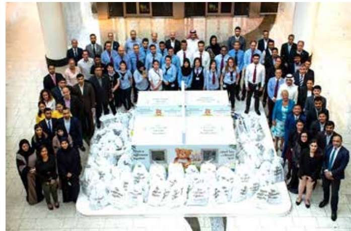
ستتولى «الجمعية الإسلامية» البحرينية مهمة توزيع التبرعات على الأسر المتعففة

معياً بالملابس والألعاب والكتب والأطعمة غير القابلة للتلف. وستتولى «الجمعية الإسلامية» البحرينية مهمة توزيع التبرعات على الأسر المتعففة في أرجاء مملكة البحرين تماشياً مع روح الشهر الفضيل. وتعدّ «ساهم في إسعاد المحتاجين» أكبر حملة خيرية تنظّمها «ماجد الفطيم»، وشارك فيها السنة الماضية أكثر من 13