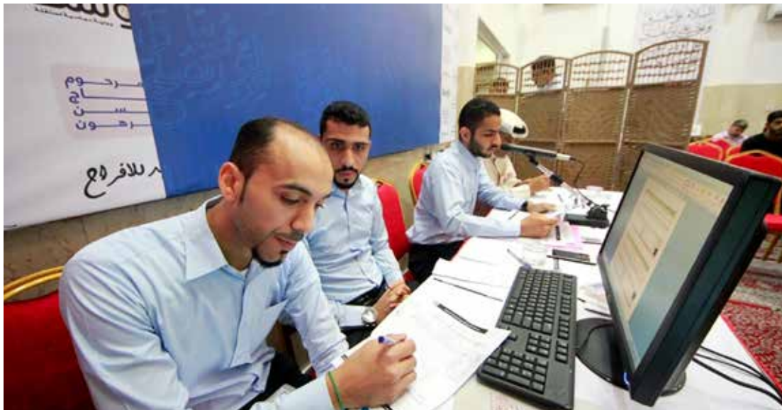
بعد حسم المتأهلين تستكمل الجولتان الثالثة والرابعة بأربع مجموعات جديدة ستة فرق في كل مجموعة