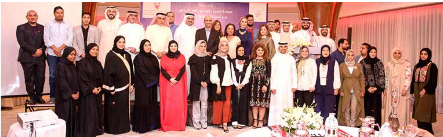
تزايد الاهتمام بريادة الأعمال في مملكة البحرين

وكشفت مديرة البرنامج أن الفائزين بالمراكز الثلاثة سيحصلون جميعهم على جوائز قيمة، وهي حاضنات أعمال من سيف بزنس سنتر وجمعية البحرين لتنمية المؤسسات الصغيرة والمتوسطة، وجوائز نقدية من جمعية الريادة الشبابية، وتخصيص مدير علاقات من تمكين لمساعدة الفائزين في تقديم الطلبات وحضور لقاءات إرشادية.