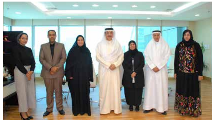
وزير العمل مستقبلاً فريق عمل مشروع خطوة للمنتجات المنزلية

خطوة للمشروعات المنزلية إلى استقطاب الأسر والأفراد القادرين على العمل ولديهم أفكار أو مهارات معينة، وإتاحة الفرصة لمن لا يملكون سجلاً تجارياً الحصول على رخصة عمل من المنزل، وكذلك مساعدتهم على النهوض بأنشطتهم وأعمالهم إلى أن يصلوا إلى مرحلة الحرفية واليدوي والوصول إلى السوق كأصحاب أعمال ورواد عمل جدد، حيث يتولى المشروع تأهيلهم وتدريبهم من خلال الدورات التدريبية بالمراكز الاجتماعية التابعة للوزارة ومركز خطوة للمشروعات المنزلية، ومن ثم إعطاء الصيغة القانونية والرسمية لهذه المشاريع والمنتجات بإصدار ترخيص «المنزل المنتج» لممارسة العمل من المنزل، بحيث تصبح الأسرة منتجة ومساهمة فعالة في الاقتصاد الوطني.