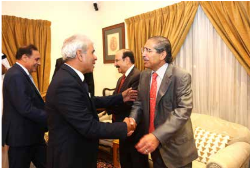
الاقتصاد كان له حظ وفير في نقاشات الحضور بمجلس فيصل جواد