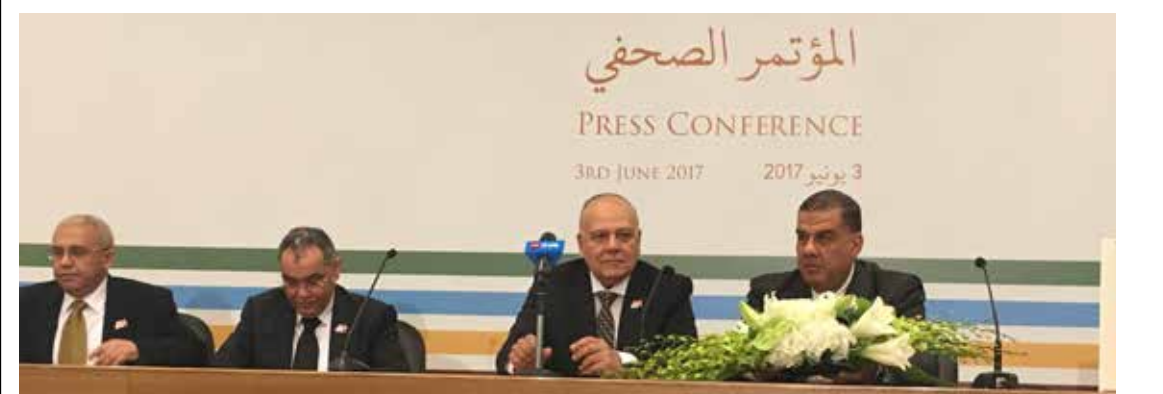
المؤتمر الصحفي عقب حفل تسليم جائزة عيسى لخدمة الإنسانية مساء أمس