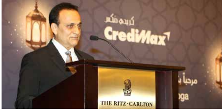
الرئيس التنفيذي لكريدي ماكس في غبقة الشركة السنوية لشركائنا

وأكد الرئيس التنفيذي لشركة «كريدي ماكس» أن الشركة تتعاون بشكل وثيق