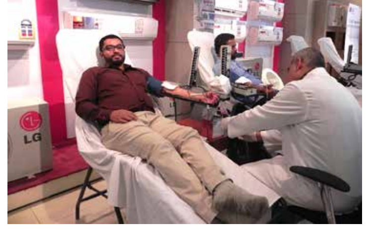
شارك أكثر من 100 موظف من مجموعة في حملة التبرع بالدم

ويستضيف شاطئ مراسي البحرين، الذي يمتد مسافة 2 كيلومتر ويحتوي منطقة تنزه حيوية، بصورة دورية، أنشطة عائلية ومجانية