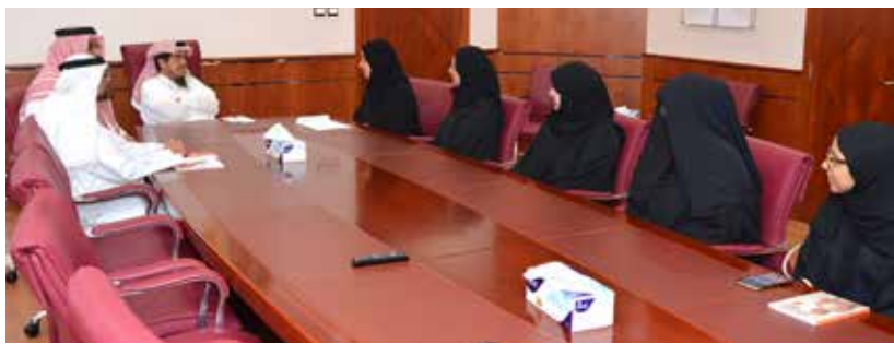
رئيس ديوان الخدمة المدنية مستقبلاً وفد جمعية أمنية طفل

■ الوسط - محرر الشؤون المحلية □ أعلن وزير الخارجية الشيخ خالد بن أحمد آل خليفة، عبر حسابه على موقع التواصل الاجتماعي «تويتر»، عن استرداد حسابه، بعد تعرضه للاختراق، يوم أمس السبت (3 يونيو/ حزيران 2017). وبعد نحو سبع ساعات من الاختراق الذي بدأ من تسلسل التغريدات زمنياً أنه بدأ نحو الخامسة والنصف من صباح يوم أمس، نشر الوزير تغريدة جاء فيها: «الحمد لله تم استرجاع الحساب... شكراً لجهودكم أصدقائي الأعتز في إبلاغ تويتير. جزاكم الله خيراً». وتبع ذلك تغريدة صدرت عن حساب وزارة الخارجية الرسمي، أكدت فيه استرجاع الوزير