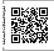
للمزيد من المقالات السابغة

يقول حاكم دبي: «التغيير يبدأ دائماً بفكرة ورؤية وإيمان، يتبعه تنفيذ وإخلاص وتقان... فعلاً التغيير لا يبدأ بالتمني ولكن بالفعل والإخلاص والتقاني من أجل التحسين وإذابة المجتمع في مكوّن واحد، وهوية واحدة وهدف واحد».