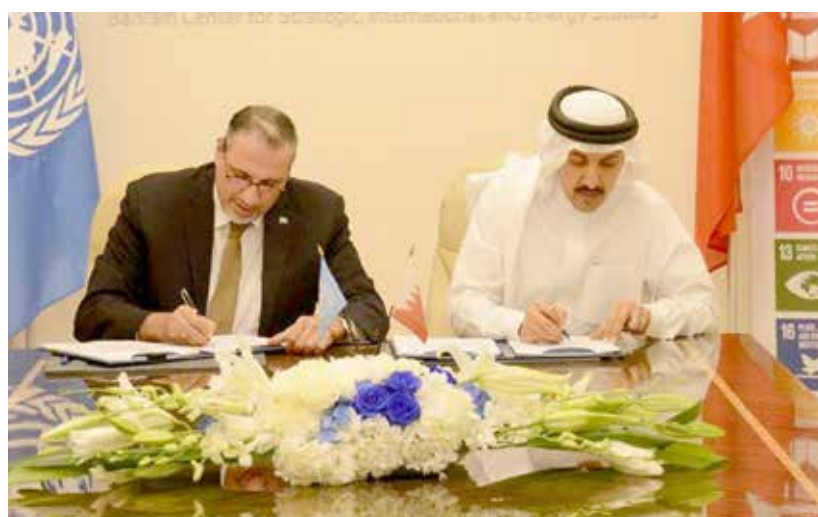
أثناء توقيع الاتفاقية بين مركز «دراسات» وبرنامج الأمم المتحدة الإنمائي

على وثيقة مشروع تعاون مشترك لإعداد تقرير مملكة البحرين للتنمية البشرية، وذلك بمقر المركز. ويتناول تقرير التنمية البشرية في مملكة البحرين موضوع النمو الاقتصادي المستدام وتعزيز فهم مساراته، وذلك بالمواءمة مع