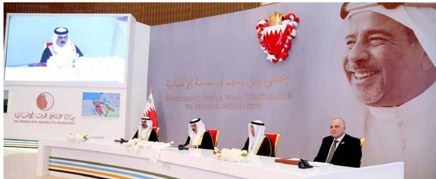
جلالة الملك بحضور سمو رئيس الوزراء يشمل برعايته الكريمة حفل تسليم جائزة عيسى لخدمة الإنسانية بنا (التفاصيل ص 2 و 3)

وزير الخارجية يسترد حسابه على «تويتر» بعد ساعات من اختراقه