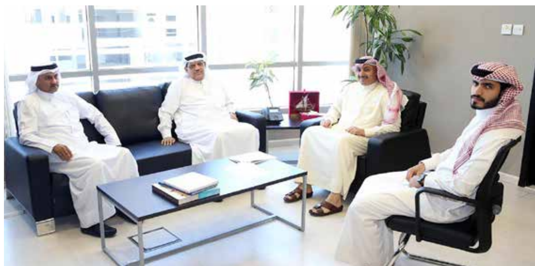
رئيس نادي الاتحاد خلال لقائه بمسؤولي الشباب والرياضة