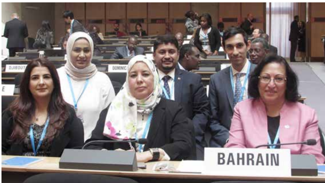
الصالح مترسة وفد البحرين المشارك في أعمال جمعية الصحة العالمية بجنيف

كما أكدت خلال مداخلتها حول موضوع الوقاية من السرطان ومكافحته على أهمية أن توفر الأمانة العامة المزيد من الدعم التقني للدول الأعضاء في هذا المجال من خلال تحديد الاحتياجات والأولويات الوطنية الخاصة بالسرطان وتقييمها ومراجعتها، ولاسيما وأن السرطان هو أحد الأسباب الرئيسية للوفاة في العالم ومصدر قلق متزايد على مستوى الصحة العامة، والجدير بالذكر أن 68% من الدول الأعضاء بمنظمة الصحة العالمية والبالغ عددهم 194 دولة لديها سياسة واستراتيجية مفعلة في مجال الوقاية من الأمراض غير السارية ومكافحتها، وذلك حسب المسح الذي أجرته المنظمة عام 2015 لقياس قدرات البلدان، وإن مملكة البحرين قد قامت بوضع