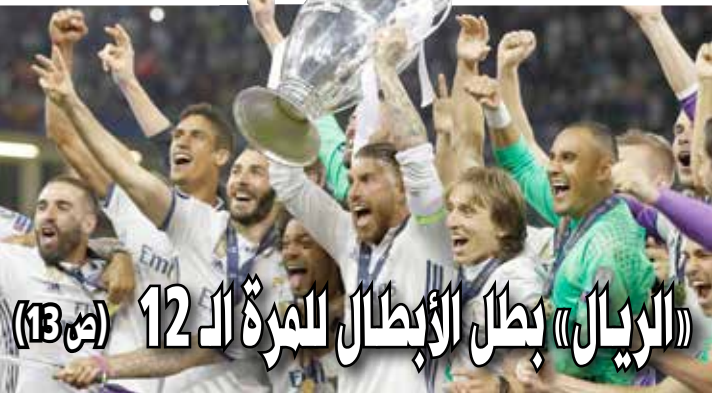
«الريال» بطل الأبطال للمرة الـ 12 (ص 13)

■ الوسط - محرر الشؤون المحلية □ أعلن وزير الخارجية البحريني الشيخ خالد بن أحمد آل خليفة، عبر حسابه على موقع التواصل الاجتماعي «تويتر»، عن استرداد حسابه، بعد تعرضه للاختراق، يوم أمس السبت (3 يونيو/ حزيران 2017). وبعد نحو سبع ساعات من الاختراق الذي بدأ من تسلسل التغريدات زمنياً أنه بدأ نحو الخامسة والنصف من صباح يوم أمس، نشر الوزير تغريدة جاء فيها: «الحمد لله تم استرجاع الحساب... شكراً لجهودكم أصدقائي الأعزاء في إبلاغ تويتر. جزاكم الله خيراً». (التفاصيل ص 5)