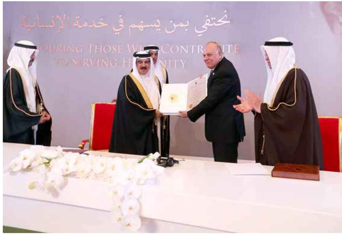
جلالة الملك لدى تسليمه جائزة عيسى لخدمة الإنسانية لمؤسسة مستشفى سرطان الأطفال بمصر

يسعدني أيضاً أن أكون وزملائي اليوم ممثلين لمؤسسة مستشفى سرطان الأطفال 57357 التي تشرفت بنيل جائزة عيسى لخدمة الإنسانية في دورتها الثالثة... هذه الجائزة العريقة التي أسست تكريماً وتخليداً لأمير