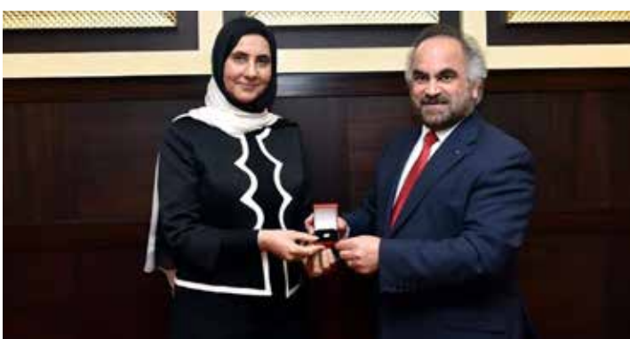
جواهرى: المرأة في جيبك قد أثبتت كفاءتها المهنية بكل جدارة واقتدار

كي يتمكن من الوصول إلى أعلى المناصب القيادية بالشركة، مؤكداً اعتماد الشركة على منهجية مدروسة لإحلال أصحاب الكفاءات التي تتمتع بالخبرة والإلمام الكافي بمتطلبات العمل وذلك بعد تدريبهم وتسليحهم بالمؤهلات التي تمكنهم من الإدارة والقيادة الناجحة. وأشار إلى البرنامج الطموح الذي وضعته الشركة للتدريب والتطوير بهدف إفراح المجال للطاقات الوطنية الشابة لاعتلاء الوظائف القيادية بالشركة.