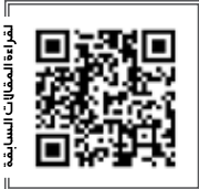
للمزيد من المقالات السابغة

نحن هنا لا نحرض الدولة، على النيل من مخالفيها، بمثل ما يفعل بعض الموتورين، من أجل بغيتهم إثبات الوطنية المفقودة إلا بمقابل، بقدر ما نود أن نرى عدلاً في الوطن، ومساواة بين المواطنين، في الحقوق والواجبات وأمام القانون.