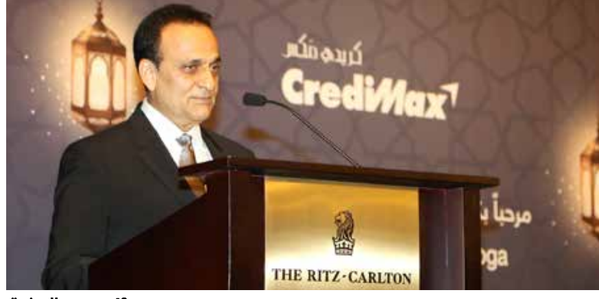
الرئيس التنفيذي لكريدي ماكس في غيبة الشركة السنوية لشركائنا

وتحدث الرئيس التنفيذي لشركة «كريدي ماكس» عن طرق بديلة يمكن لمحلات التجزئة اتباعها للحصول على بيانات الزبون ومن بينها الطلب المباشر منه، مؤكداً أن الشركة على تواصل مع مختلف محلات التجزئة لمد المساعدة في هذا الشأن.