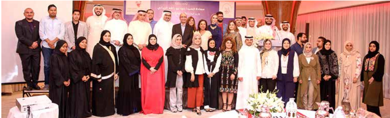
تزايد الاهتمام بريادة الأعمال في مملكة البحرين

وكشفت مديرة البرنامج أن الفائزين بالمراكز الثلاثة سيحصلون جميعهم على جوائز قيمة، وهي حاضنات أعمال من سيف بزنس سنتر وجمعية البحرين لتنمية المؤسسات الصغيرة والمتوسطة، وجوائز نقدية من جمعية الريادة الشبابية، وتخصيص مدير علاقات من تمكين لمساعدة الفائزين في تقديم الطلبات وحضور لقاءات إرشادية.